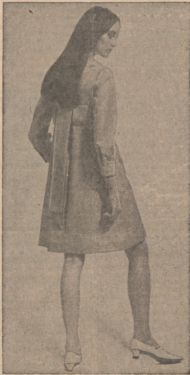
Suknia wiosenna z "Mardi Gras Cloth" o bardzo skromnych liniach, przybrana jest japońskim "obi" na plecach.

Uczymy nasze Matki w dniu ich święta! Kochajmy, czcimy i szanujmy ich zawsze, codziennie, nieustannie — ale w dniu ich święta wykażmy im całe przywiązanie i umiłowanie naszych serc!