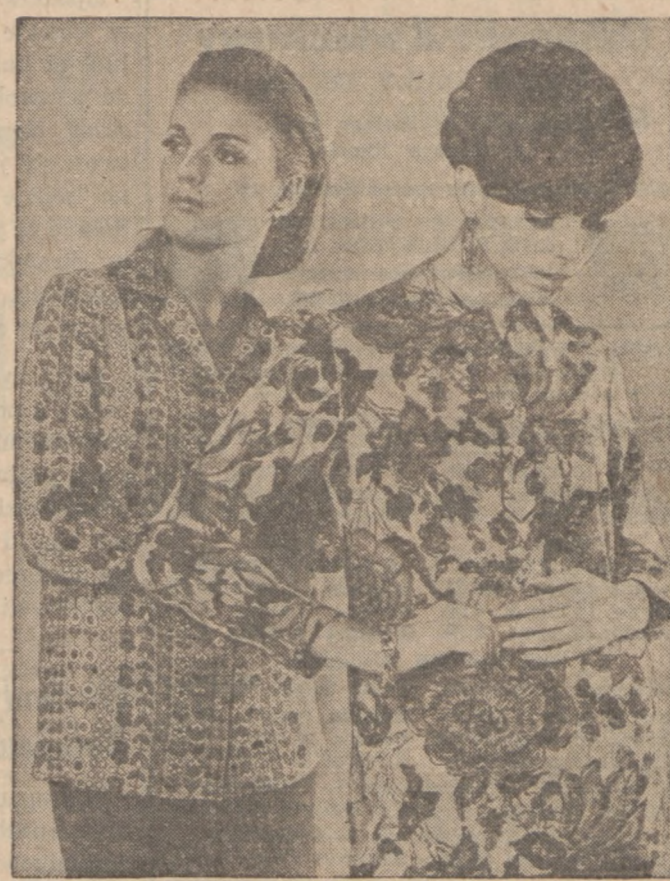
Bluzki w deseń różnokolorowy będą bardzo popularne w sezonie wiosennym. Czym więcej kolorów — tym modniejsze.