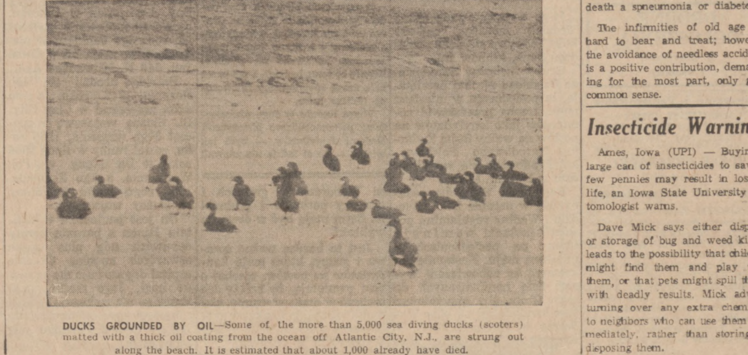
DUCKS GROUNDED BY OIL—Some of the more than 5,000 sea diving ducks (scoters) matted with a thick oil coating from the ocean off Atlantic City, N.J., are strung out along the beach. It is estimated that about 1,000 already have died.