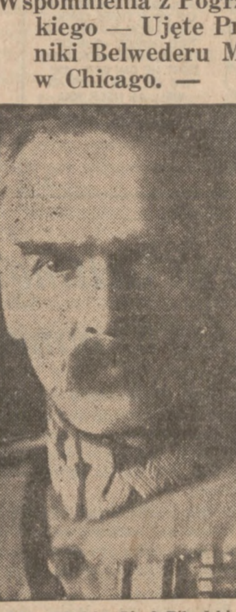
Marsz. Polski Józef Piłsudski który zmarł 12 maja 1935