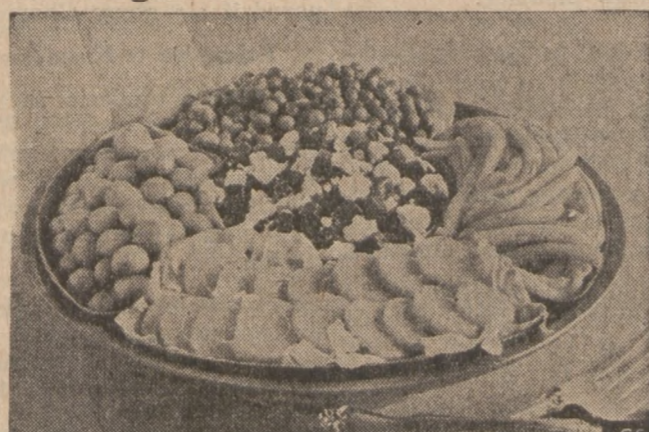
The Borden Kitchen tossed together this salad with three-fold creativity: a variety of vegetables, a marinade with gusto and, like Roquefort Cheese Beets, pleasing new partners.