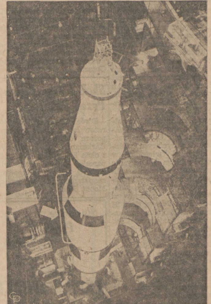
MOON ROCKET COMING APART—With work platforms removed from its sides, the first Saturn V Moon rocket stands on its mobile launch stand inside its towering assembly building at Cape Kennedy, Fla. Carrying a dummy Apollo spacecraft, the awesome, 364-foot rocket is to be taken apart for inspection of its second stage (arrow) for possible cracks in fuel tank welds.