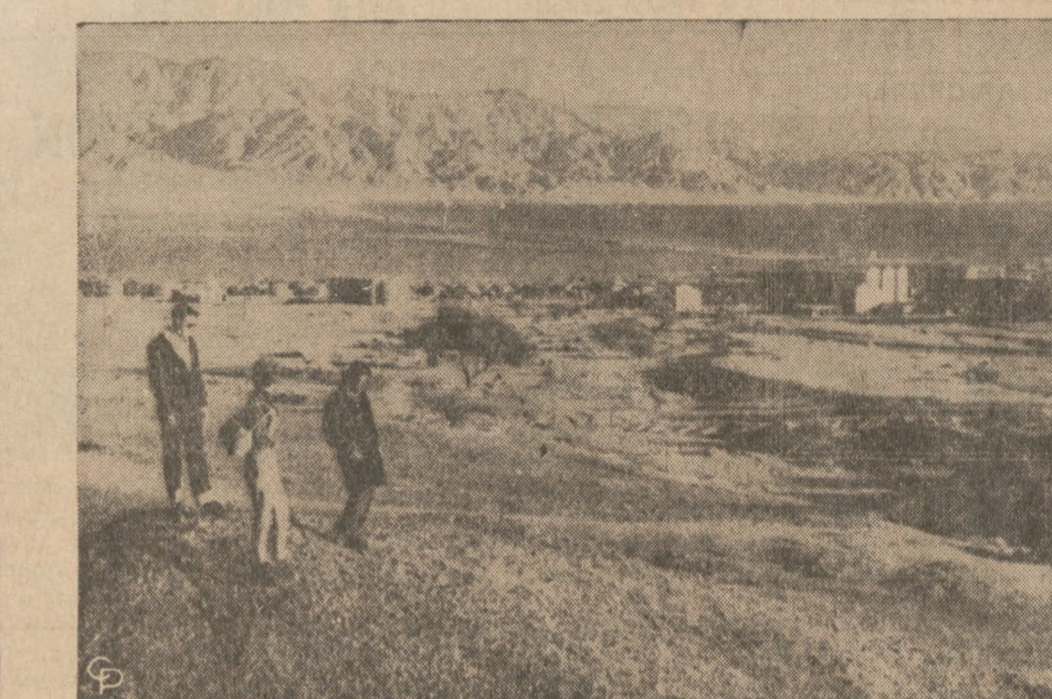
TO JEST IZRAELSKI PORT EILAT, — położony najbardziej na południu, w północnej części Zatoki Akwaba, która stanowi jedyną izraelską drogę do Morza Czerwonego. Zjedn. Republika Arabska podjęła kroki, celem zablokowania tej drogi. Zatoka Akwaba jest po prawej stronie zdjęcia, a dalej za nią widoczne są góry Jordanii po lewej, a Arabii Saudyjskie po prawej.

Urzednicy miejscy powiedzieli, że jeżeli fabryka, lub większy budynek nie wypełni kwestionariusza to może stracić licencję na prowadzenie interesu. Celem spisu nazwanego "Air-Cen 67" jest danie przelicznikom wszystkich nowych możliwych źródeł zanieczyszczenia powietrza.