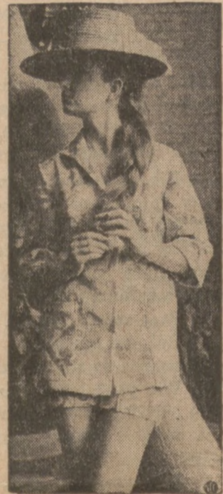
Ubranko plażowe z bawełnianej "terry cloth"

Mówią ogólnie czym bogatsze składniki w torcie, tym wolniejszy powinien być ogień przy pieczeniu. Jeżeli piec będzie miał temperaturę za niską, wtenczas ciasto podniesie się, ażeby natychmiast upaść. Za wysoka temperatura też szkodzi, bo tort pęka na wierzchu, kiedy wierzch tortu upieczą się za szybko. Piec powinien być zawsze rozgrzany przed włożeniem do niego ciasta lub tortu do upieczenia.