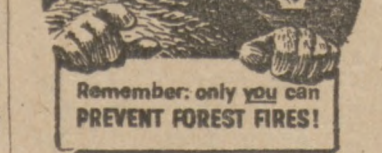
Remember, only you can prevent forest fires!

THREE-TIMER Indianapolis. (UPI)—Wilbur Shaw is the only driver ever to win the Indianapolis "500" auto race on three occasions. He won it in 1937, 1959 and 1960.