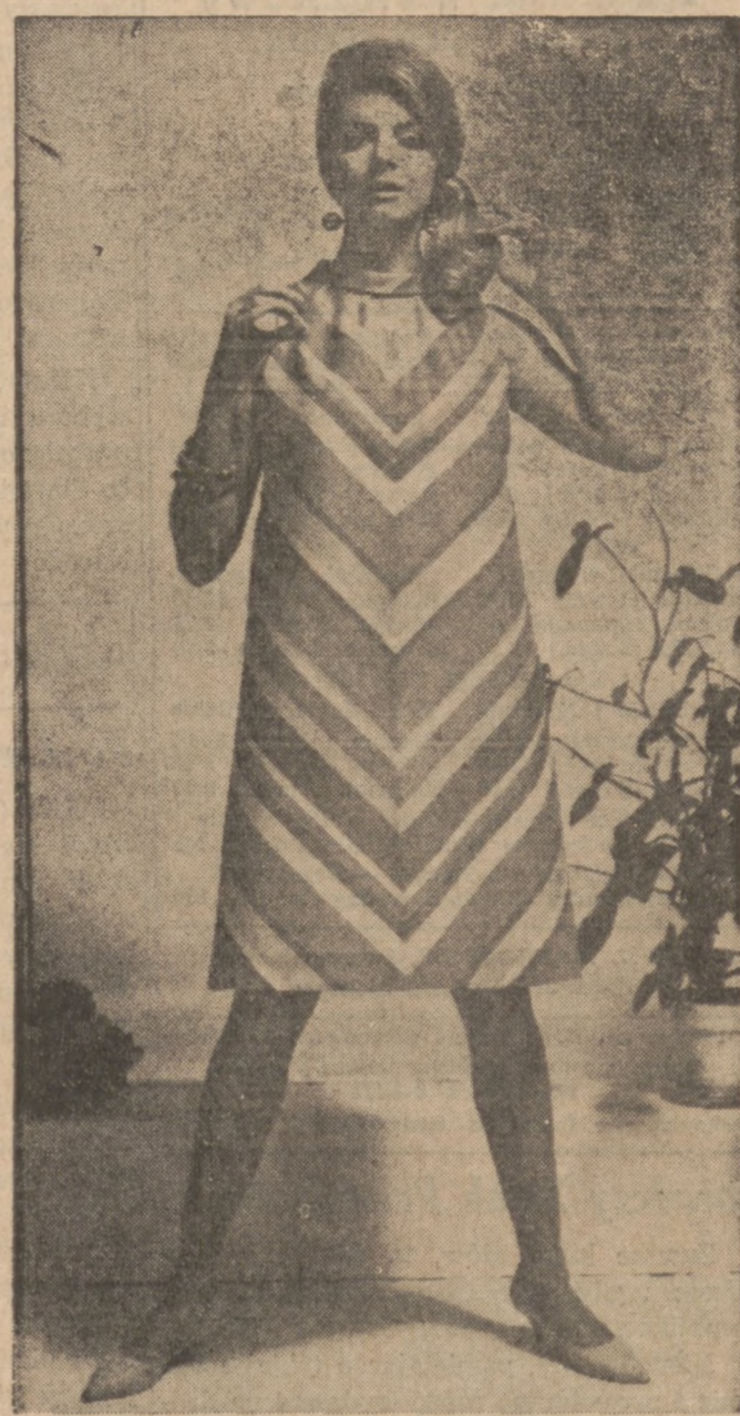
Najnowszej mody suknia letnia o luźnych liniach, uszyta z pralnej bawełny w różnokolorowe paski.

Masę nabierać łyżeczką i kłaść w sam środek każdego białka. Jest to sałata ozdoba, nietylko, że wygląda apetycznie, ale jest bardzo smaczna.