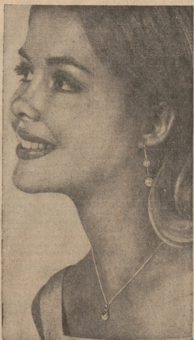
Do najbardziej cenionych podarunków graduacyjnych, należy zaliczyć prawdziwe perły. Panienska otrzymująca tak cenny podarunek — zachowa go na całe życie i będzie on stale jej przypominał najpiękniejsze lata młodości.

Jeżeli w wieku dziewczęcym wkrada się do duszy pycha, to w latach panienskich, ta pycha rozwija i potęguje się. W stosunku do innych panien, panna ograniczona pychaniami, panna ogarnięta pychą wytwarza się zazdrość, wywołana, czy to lepszym, piękniejszym strojem innych, czy też posiadaniem narzeczonego. A zazdrość u takiej panny, pycha ją do pokonania przeciwniczki, nie przebiegając często w środkach. Pycha jest źródłem wielu nieszczęść.