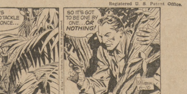
Registered U.S. Patent Office.