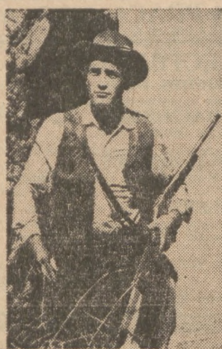
Hombre means Man... and Paul Newman plays the title role as "Hombre" in Martin Ritt's western epic in color now playing at the cool B & K Congress Theater, 2135 Milwaukee Ave. Co-feature: "The Western Classic" "Sinner" starring Alan Ladd, Jack Palance, Van Heflin and Brandon De Wilde.