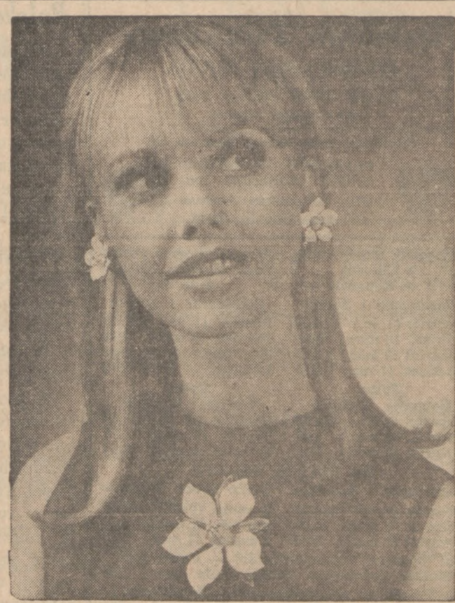
Broszka i kolczyki z emaliowanej stali.