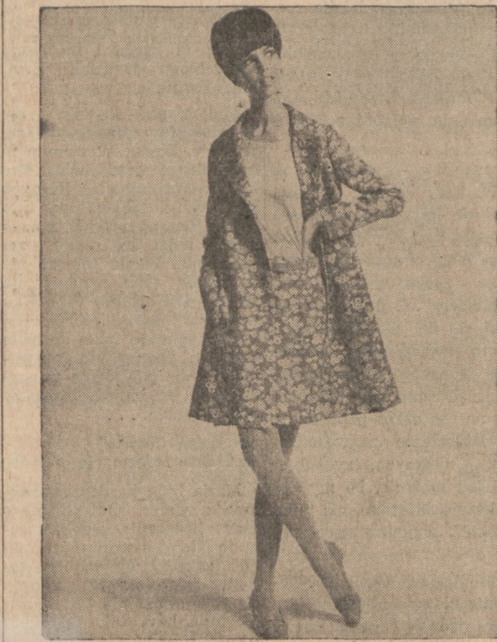
Praktyczny komplet do podróży, składa się z płaszcza i spódnicy z niemnącej się krepy w deseniu i bluzeczki "jersey".

Wina białe powinny stać na chłodzie kilka godzin przed podaniem, renskie nawet najlepiej smakują podane z lodu. Wina czerwone gdy mają temperaturę pokojową. Szampa należy na parę godzin zamrozić w lodzie z solą. Przy nalewaniu, aby butelka ręką nie mroziła, owijają się ją białą serwetką. Każdy rodzaj wina powinien być podany w odpowiednich do niego kiłskach.