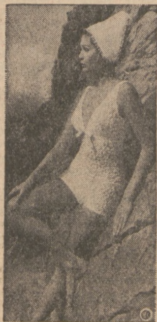
Kostium kąpielowy z koronkowej bawełny.

Wydatność pracy zależna jest w bardzo dużym stopniu od stanu psychicznego jednostki. Jeżeli jednostka ta jest niezadowolona, rozdrażniona czy też po prostu przygnębiona z przyczyn chociażby czysto osobistych, trud jej już nie da tyle rezultatów, jakich należałoby się spodziewać.