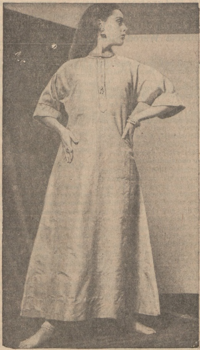
Negliż w stylu hinduskim, uszyty z surowego jedwabiu.

tłuszczu dochodzi do 34.5 procent, a gdy dojdzie do 50 roku życia, ilość tłuszczu w jej ciele sięga 38.5 procent. U mężczyzn jest inaczej — gdy liczy lat 35 ma 17.3 procent tłuszczu; gdy dochodzi do 41 lat, ma 21.6 procent; a gdy liczy 55 lat, procent tłuszczu wynosi 25.9. Zamąca Krew Przy każdym pożywieniu spożywamy pewną ilość tłuszczu, który następnie w niewielkiej ilości dostaje się do krwi. W normalnym ciele tłuszcz ten niknie w kilku godzinach przez oczyszczanie. — Jednak w ciele funkcjonującym wadliwie, tłuszcz ten zamąca krew i w małych ilościach osiada się na ściankach naczyń krwionośnych, powodując najrozmaitsze choroby serca, jak również powoduje twardnienie arterii. Uczeni utrzymują, iż 95 procent ataków sercowych spowodowanych była właśnie tym nadmiarem tłuszczu w ciele ludzkim, który dostaje się do krwi. Nowy Środek Przeprowadzając obecnie eksperymenty z nowym środkiem "oczyszczającym" uczeni mają nadzieję znalezienia sposobów odkrywania ilości tłuszczu w żyłach i ustalenia komu właściwie grozi atak serca.