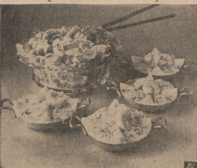
Party day, busy day, any day—thank heaven for the no-fuss dinner. The Borden Kitchen had just such a hurried homemaker in mind when they created shrimp-egg ramekins smoothly sauced with Gruyere cheese. Complement with a crisp green salad, refrigerated biscuits topped with browned, and—dinner's ready.