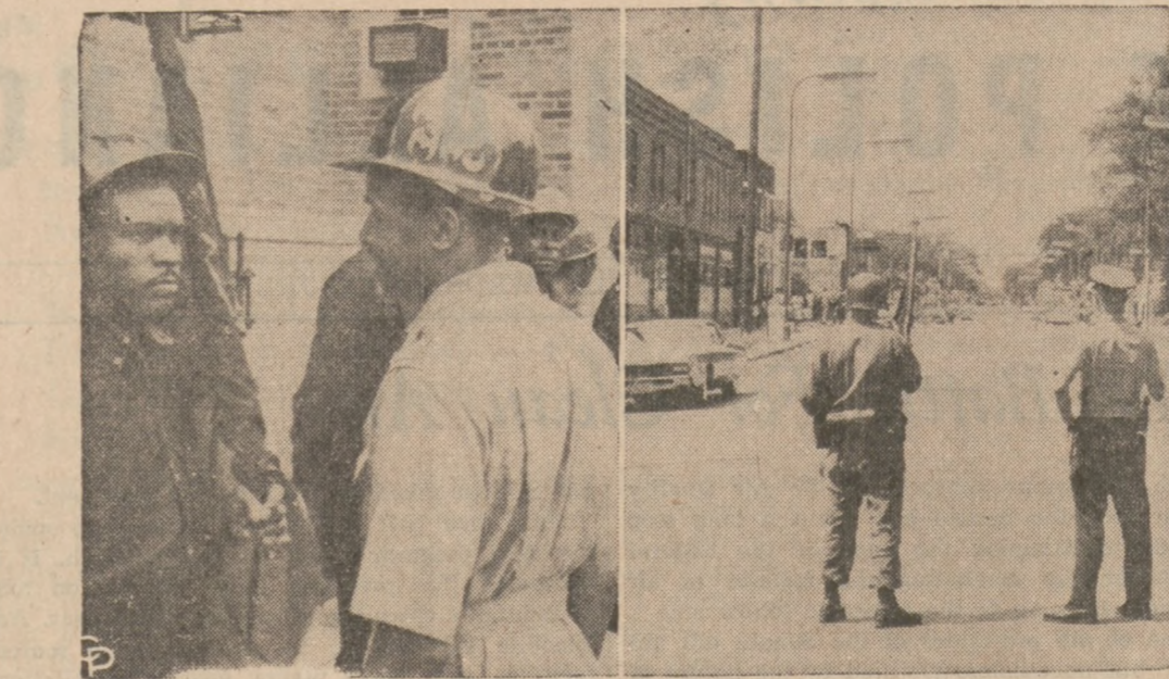
CZARNA SIŁA I SKRĘPOWNY POKÓJ — Gdy będący w hełmach ekstremiści z Harlem (po lewej) zaciągają straż na zewnątrz Cathedral House w Newarku, N. J., w którym odbywa się "czarna siła" konferencja Kongresu Rasowej Równości, to dzielnicę przy Plymouth Ave. w Minneapolis (po prawej) jest pod kontrolą Gwardii Narodowej i policji po trzech nocach rozruchów. Podczas informowania prasy na zebraniu w Newarku, delegaci wdarli się do pokoju informacyjnego, połamali kamery i taśmy rekordujące, oraz pobili kilku dziennikarzy.

Bezplatne Telefony Na Biednej Kubie Londyn (DP) — Ubożuchna Kuba wprowadziła bezpłatne lokalne rozmowy telefoniczne. Każdy będzie mógł gadać za darmo z budki telefonicznej.