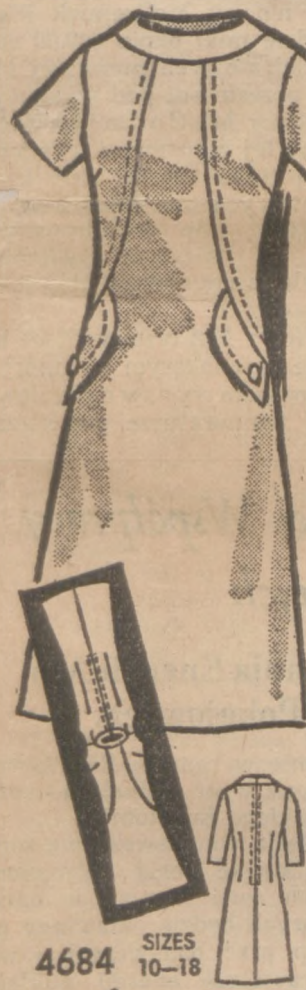
4684 SIZES 10-18 by Anne Adams

Tu jest sugestia. Będziecie w niej wygodnie spędzać radosne dni i wieczory. Święty fason. Stebnowana począwszy od mankietowego kołnierzyka aż do małych patek na biodrach.