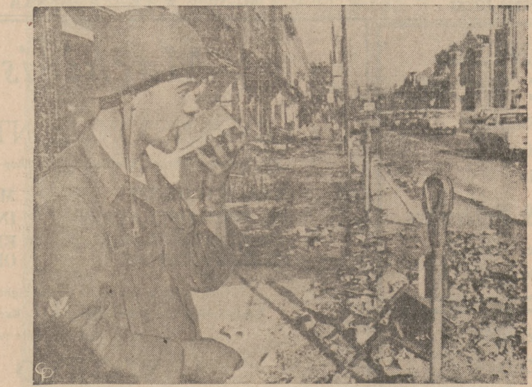
PRZERWA NA ARBUZA. — Pełniący służbę na obszarze zniszczonym podczas rozruchów w Detroit, Gwardzista Narodowy konsumuje arbuza, stojąc na ulicy pokrytej gruzami.

W wielu rejonach i w przedmieściach, 5-procentowy stanowy podatek od sprzedaży w Chicago wejdzie w efekt dopiero od dnia 1-go września. Cała ta podwyżka stanowego podatku od sprzedaży i usług użyteczności publicznej oraz od napraw ma przynieść dla stanu 600 milionów dolarów dochodu.