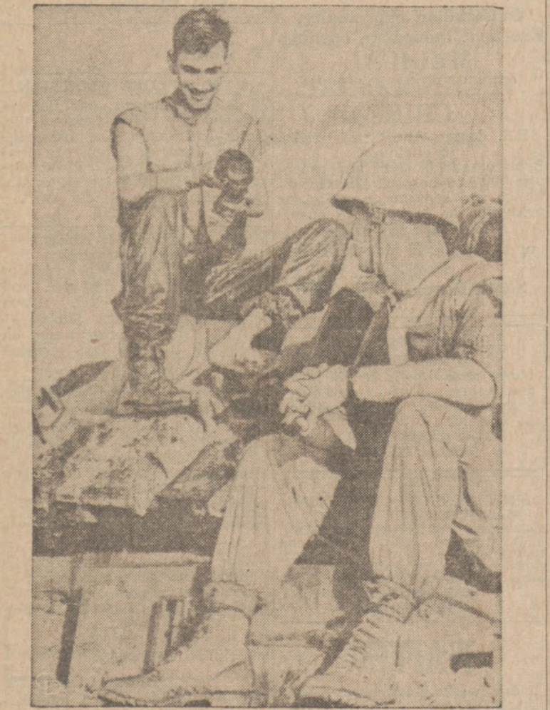
OPERACJA "BEAR CHAIN" W POŁUDN. WIETNAMIE, celem oczyszczenia z nieprzyjaciela prowincji Quang Tri w pobliżu Strefy Zemilitaryzowanej widocznie nie jest tak bardzo zagrożona, by żołnierzy Korpusu Marynarki nie mógł wypruć swych skarpet.