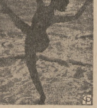
BREEZY—Sylvia Ludwigs stirs a breeze on Treasure Island at Florida's St. Petersburg

stirs a breeze on Treasure Island at Florida's St. Petersburg