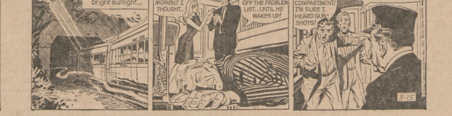
Registered U.S. Patent Office.