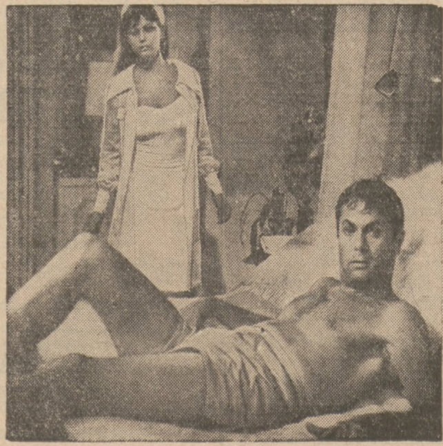
Zdłwiona niesczekiwym gościem, który przejął w posiadanie jej łóżko, pełna seksualu Claudia Cardinale w scenie filmu pod tytuł: "Don't Make Waves" obecnie wyświetlanym w B & K Congress kinie, 2135 N. Milwaukee Ave.

Plan Budowy Poczty Dep. Poczty oznajmił w środę, że budowa nowego biura pocztowego dla Park Ridge jest w stadium planowania. Budynek pocztowy będzie wzniesiony na północ od szosy Russe i na wschód od Greenwood avenue na przedmieściu. Biuro będzie pobudowane przez prywatną firmę i następnie wydane rządowi federalnemu.