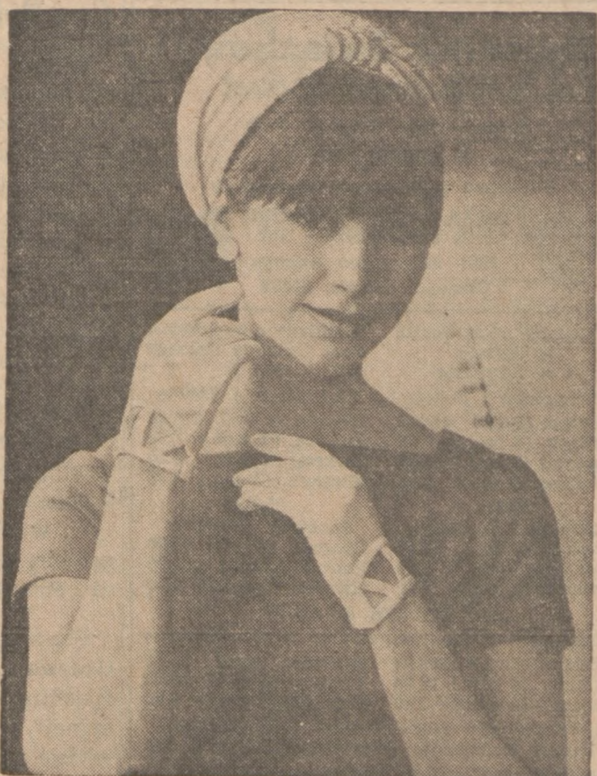
Wygodny turbanik z białej słomki i krótkie białe rękawiczki, nadaje szyku letniemu stroju.