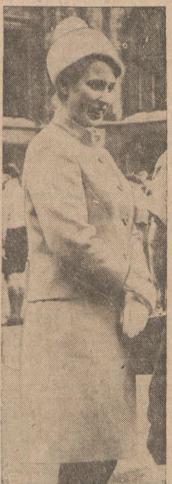
Królowna Anna, podrastająca córka królowej Anglii Elżbiety, ubrana w piękny różowy kostium wełniany i biały kapelusz.