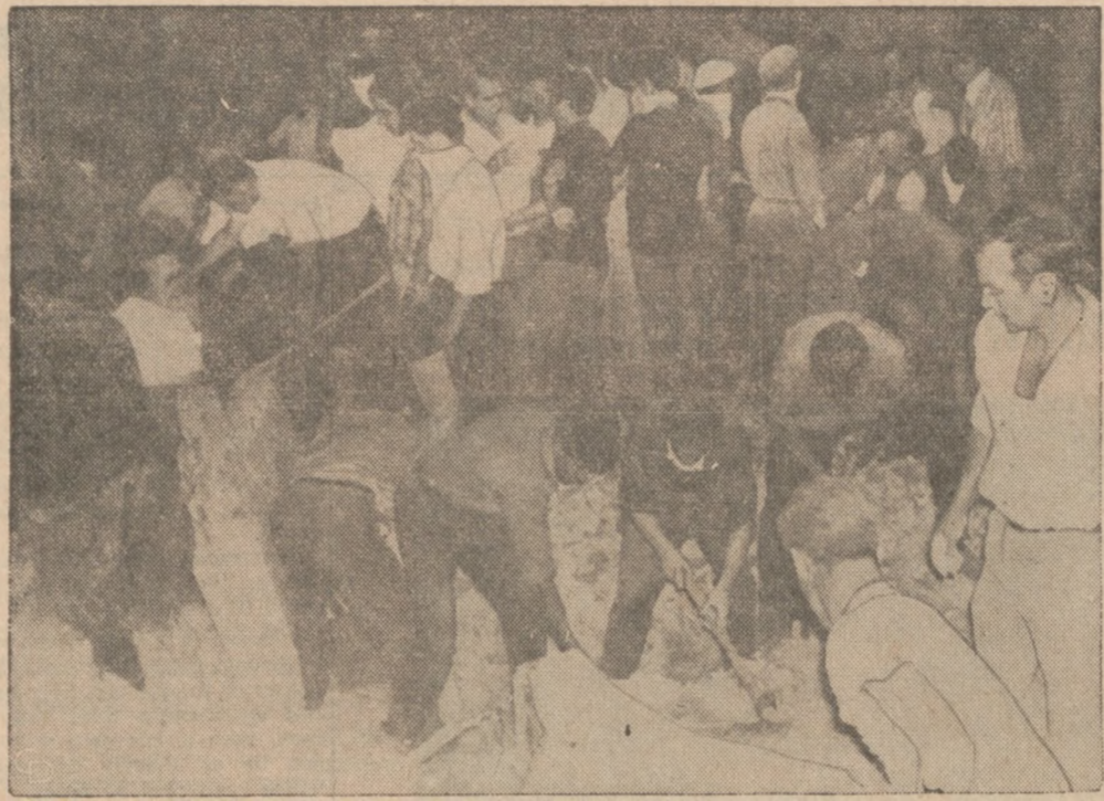
15 OSOBE STRACIŁO ŻYCIE — Ratownicy poszukują ofiar po zawaleniu się 4-piętrowego budynku w Guijello w Hiszpanii podczas święta. Większość z 15 ofiar została pogrzebana na ulicy.