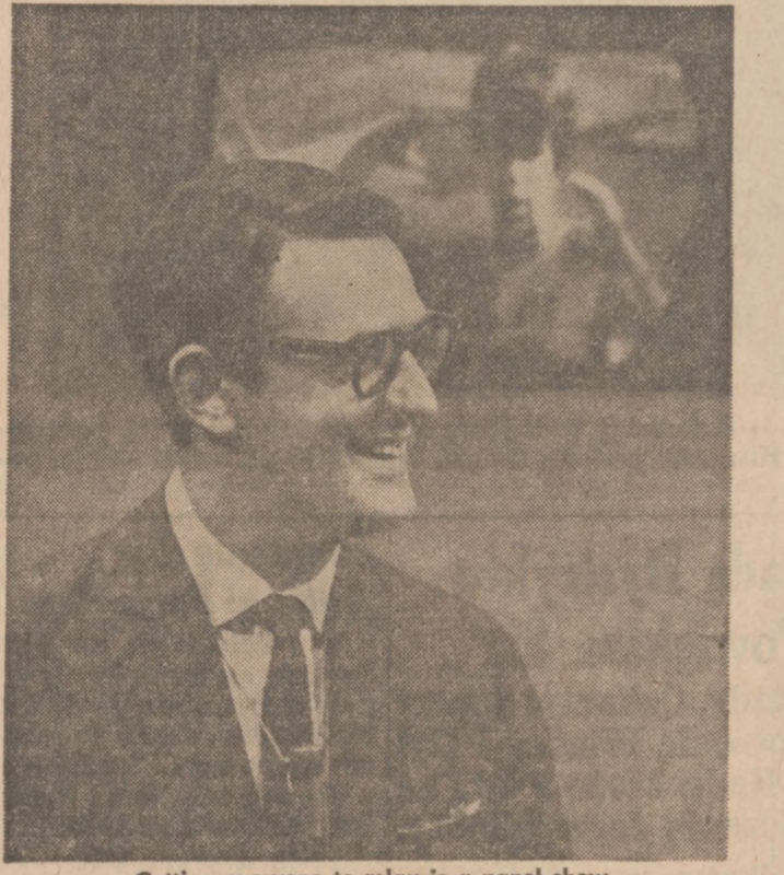
Getting everyone to relax is a panel show host's big job, according to Larry Blyden.

The future? "In this business," Larry says with a big grin. "All I want to do is to survive."