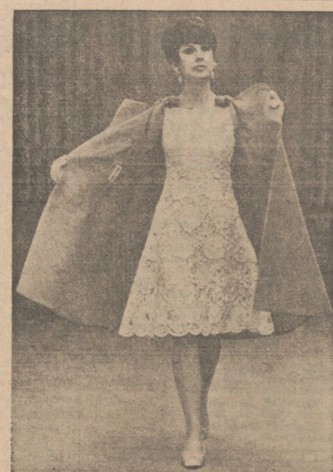
Elegancki komplet wieczorowy, kreacji Jo Copeland z Kalifornii. Suknia uszyta jest z białej francuskiej koronki, a płaszcz z amarantowego jedwabiu.

W Warszawie, w wiele, wiele lat potem, opowiadała mi matka swoje wspomnienia z tych radosnych lat młodości. Słuchając łagodnego jej głosu, w którym przewijała się nuta jakby rezygnacji, patrząc na jej twarz zmęczoną, zniszczoną przez prawie pół wieku trosk i wielkiej pracy, błogosławiłam wtedy w duszy los, który pozwolił jednak tej kobiecie brać udział w szaleńcych kuligach i zdzierać białe pantofelki w ciągu jednej nocy, zanim ją popchnął na drogę jej powołania, nieubłaganej, pełną wyrzeczeń i cierni.