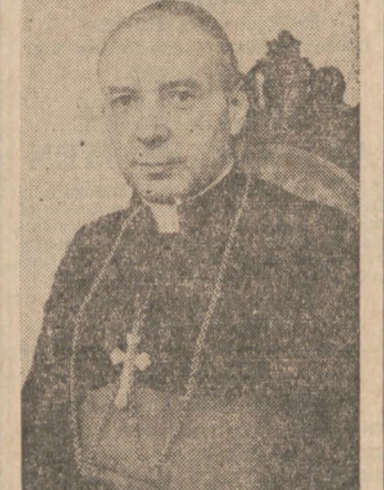
Stefan kard. Wyszyński Prymas Polski

Mam nadzieję, że te czułe słowa Prymasa Polski nie przebrzmiały bez echa w sercach Waszych a w przyszłą niedzielę miara Waszej ofiary będzie ofiarą bez miary.