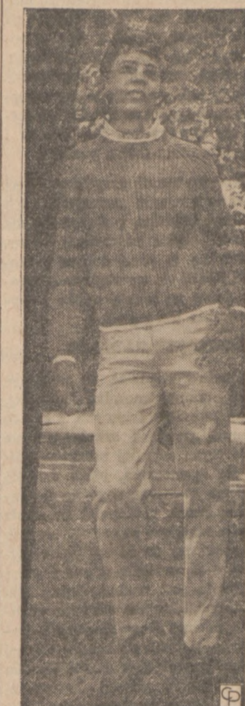
SWEATER and slacks are on-target this fall for junior boys. This rib-knit, bulky acrylic pullover sweater is stripe-accented at sleeves, collar and bottom. With it, neat look jeans in washable permanent press hopsack.

They suggest also that you never tap your watch to start it. On the positive side they encourage you to wind your watch every morning, have it cleaned once a year, have cracked crystals replaced at once.