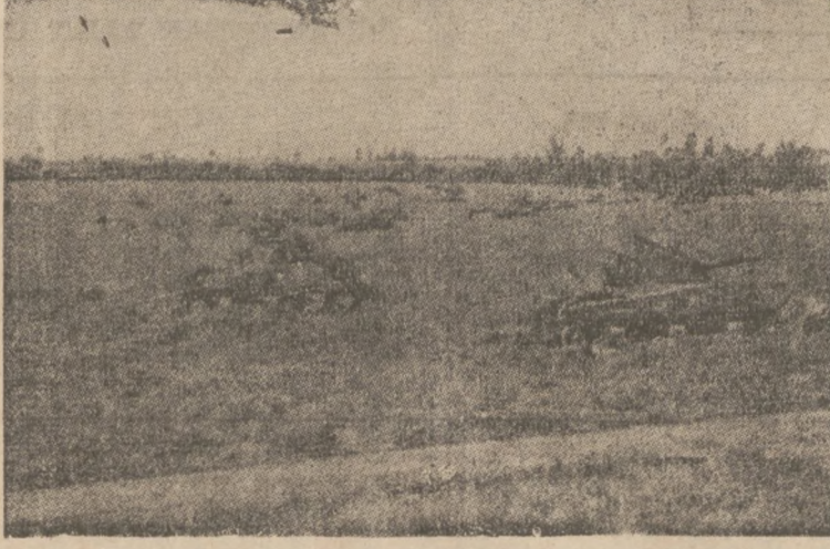
Czołgi Nacierają... (Tanks are charging...)

Planując wykonać główne zadanie na kierunku Chambois, Dywizja ruszyła wczesnym rano z zadaniem uchwycenia Chambois i w górę z "Maczugą". Sławna później nazwa "Maczuga" powstała w rozmowie radiowej szefa sztabu 10 Brygady z dowódcą Dywizji, który tak nazwał Mont Ormel, położone na północnym wschód od Chambois.