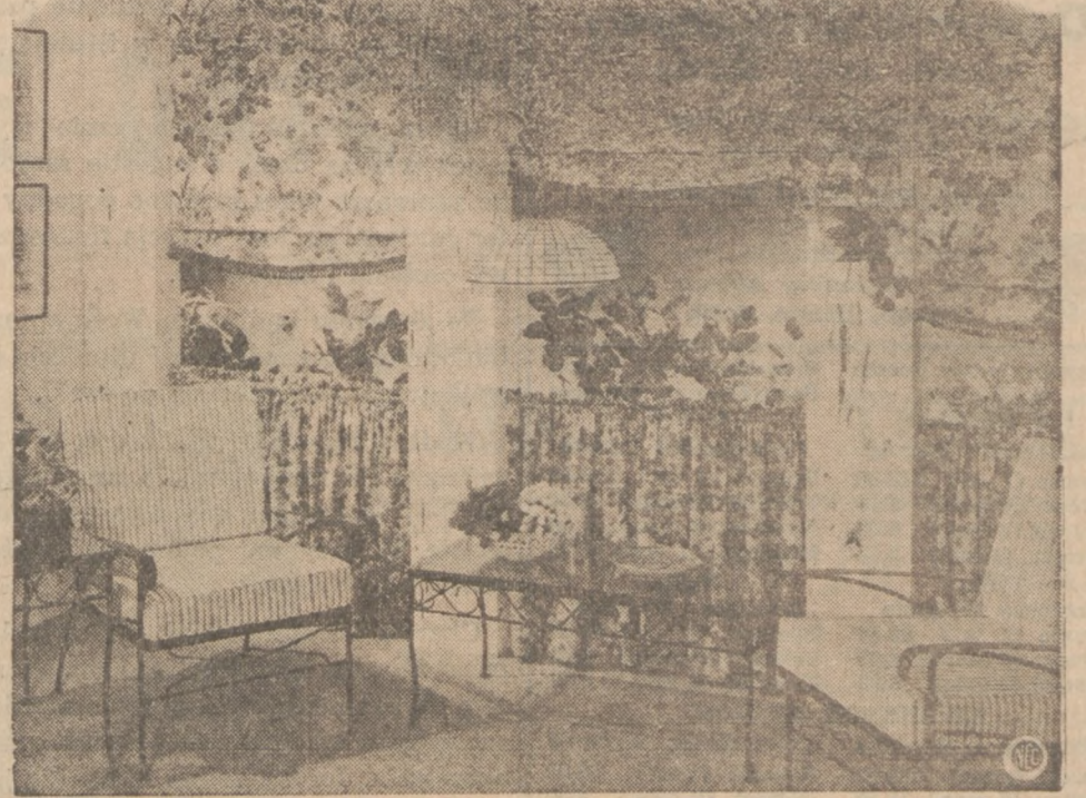
Efektownie umeblowany zakryty ganek (porch). Długie rolety i kawiarne franki, zasłaniają okna i obicie pod oknami. Do uszycia rolet i firanek użyto "cotton clipper cloth."

Posmarować pieczeń grubo masłem, zawinąć szczelnie w folię aluminiową, wstawić na pół godziny do gorącego pieca. Pozostały sos osobno zagrzać i na wydaniu połączyć z pieczęm.