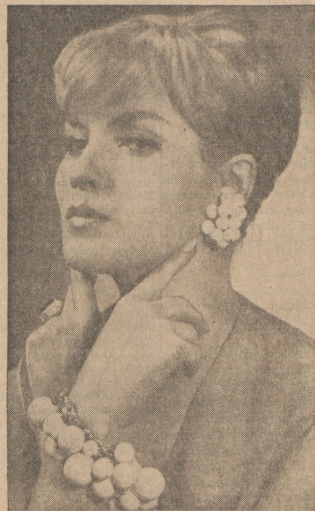
Letnia biżuteria z białej masy plastikowej.

Posmarować plasterki szynki sokiem cytrynowym do którego poprzednio dodano kilka kropli "angostura bitters". Posypać klonowym (brown) cukrem, połączyć odrobiną soku ananasowego (pineapple juice), wstawić do średnio gorącego pieca (350 stopni F) na 30 minut.