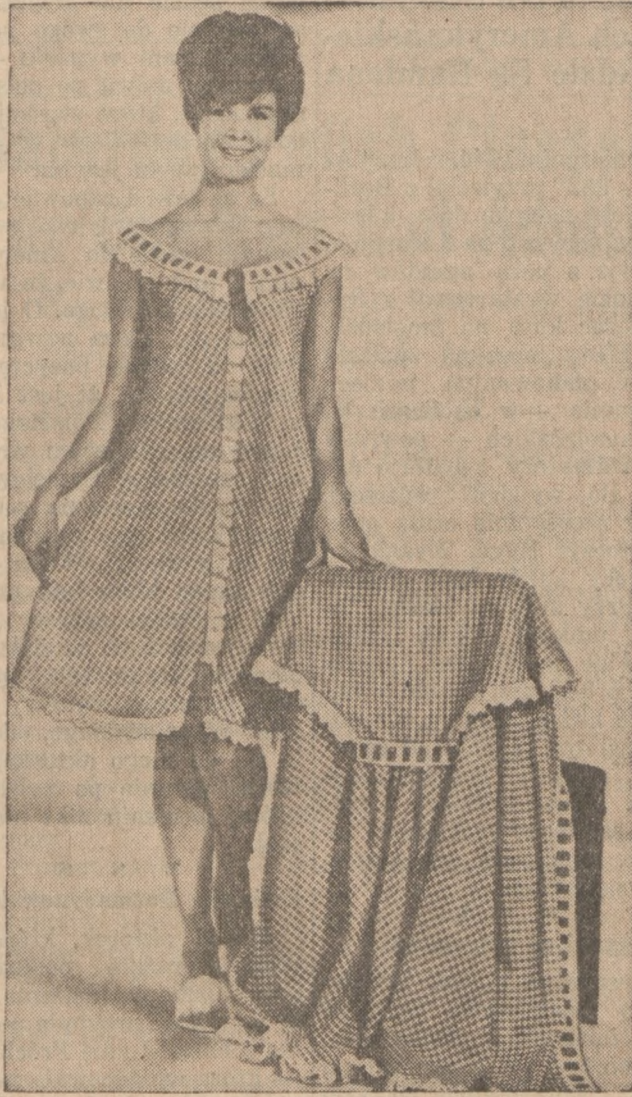
Koszulka nocna i negliz na sezon letni uszyte z lekkiego batystu w kratkę.

Jedną z czystelniczek amerykańskiego tygodnika "Woman" zwróciła się do pisma z prośbą o określenie kobiecego stylu, który najbardziej zapewniłby jej sukces w prowadzonym interesie. Odpowiedź redakcji brzmiała: "Staranne uczesanie, dyskretny makijaż, spokojny, lecz pełen sexappealu sposób ubierania się i zanim się pani spozstrzeże, będzie pani miała męża, troje dzieci i zapomni pani o całym tym nonsensie z interesem".