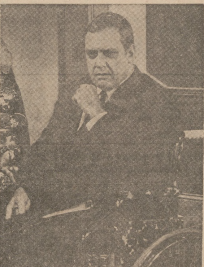
Raymond Burr will do all his 'Ironsides' acting from a wheelchair, when NBC presents the new series this fall.