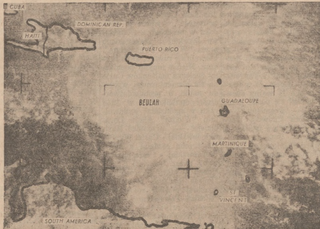
"NIMBUS" VIEWS HURRICANE "BEULAH" — This photo of hurricane "Beulah" was received at the Miami weather bureau from the weather satellite "Nimbus." "Beulah," the killer hurricane, was 160 miles due south of San Juan, Puerto Rico, and had already killed 15 persons on the Islands of Martinique and St. Vincent. Her 120-mile an hour death-dealing winds were then aimed at the Dominican Republic.