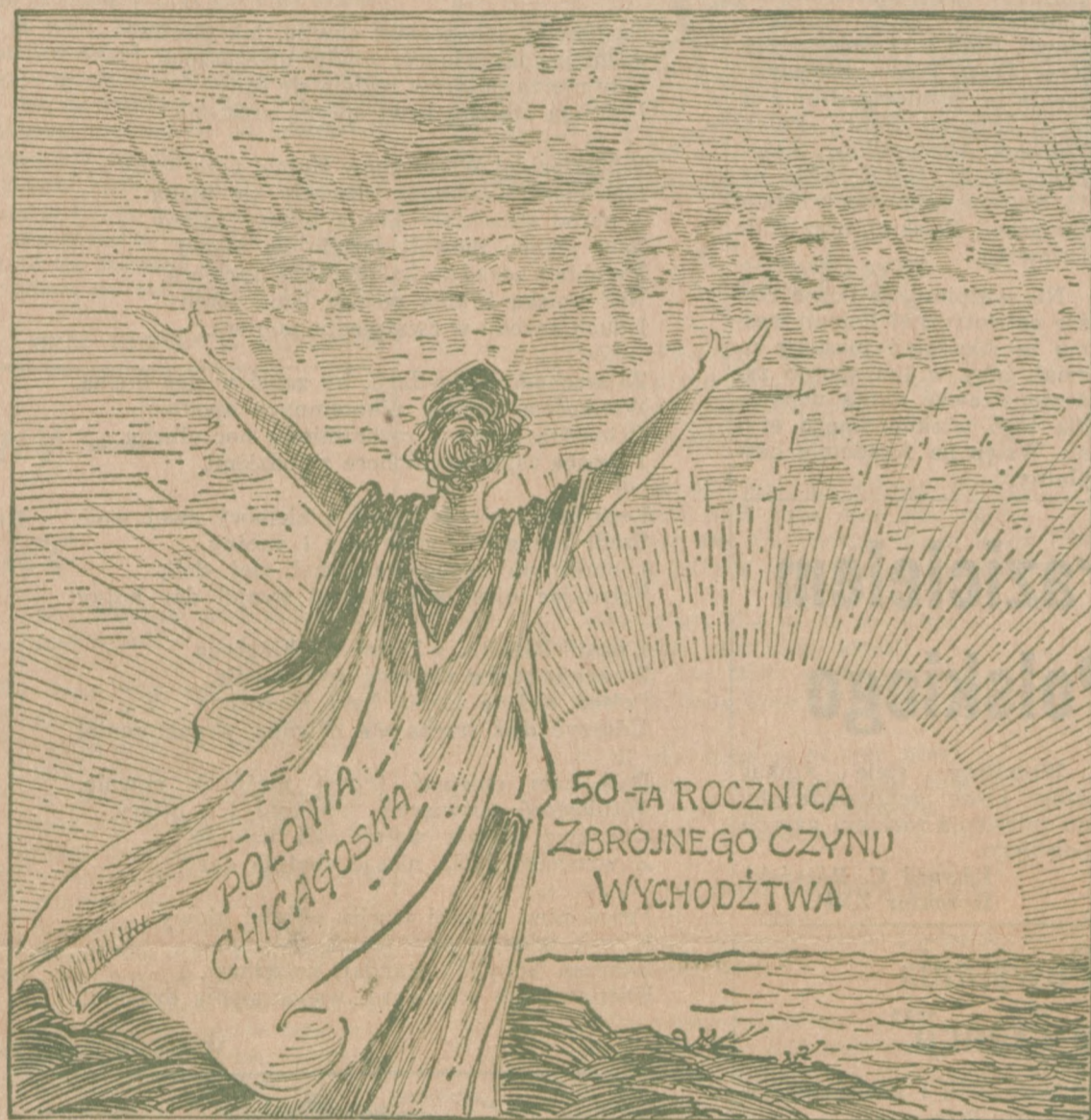
Cała Polonia złoży hołd bezprzykładnej ofierze uczestników Czynu Zbrojnego, żołnierzy Armii Ochotniczej, w niedzielę 15-go października, w Auditorium na Trójkwie (szczegóły Akademii i materiały historyczne ilustrujące Czyn Zbrojny Polonii na stronie specjalnej Dziennika Związkowego).