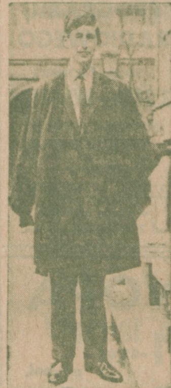
SPOŹNIŁ SIĘ — Przydziany w toge, brytyjski książę Karol rozpoczyna swoje studia w Kolegium Trinity Uniwersytetu Cambridge, Anglia, po 10-minutowym spóźnieniu się na wykłady.