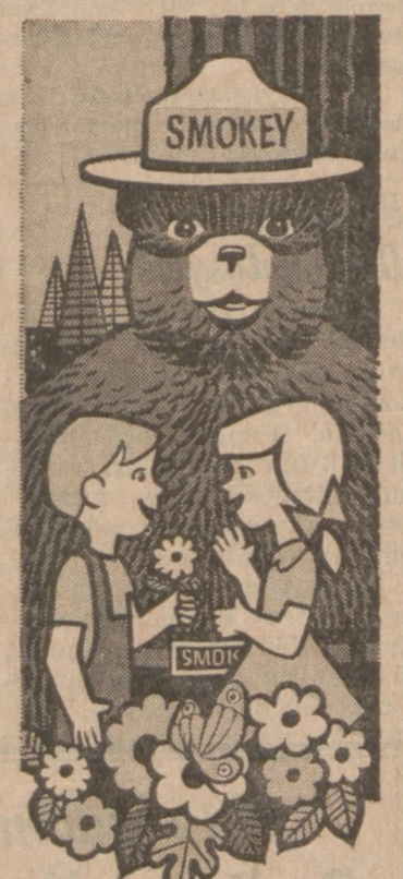
Smokey's friends don't play with matches!

The nuclear-powered submarine Nautilus covered 69,138 miles in 26 months on one nuclear fueling.