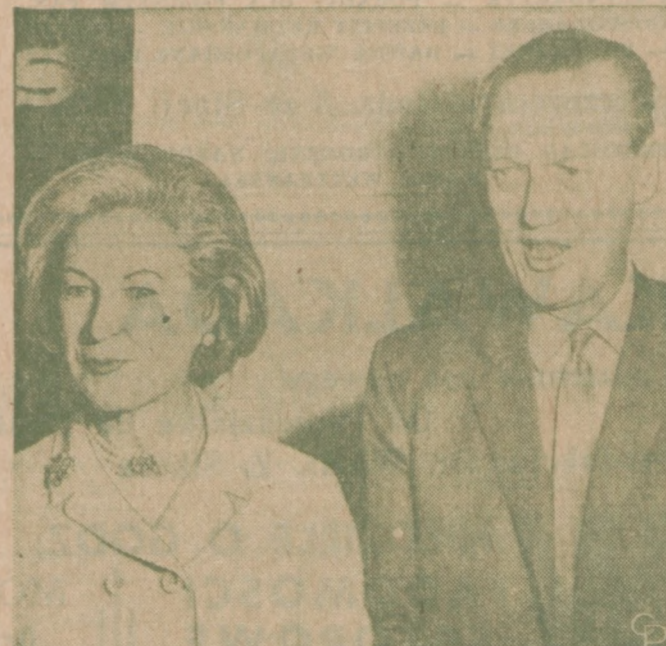
KROLEWSKA WIZYTA — Duński książę George i jego żona, księżniczka Anna, sfotografowani po przybyciu do Los Angeles z 3-dniową wizytą.