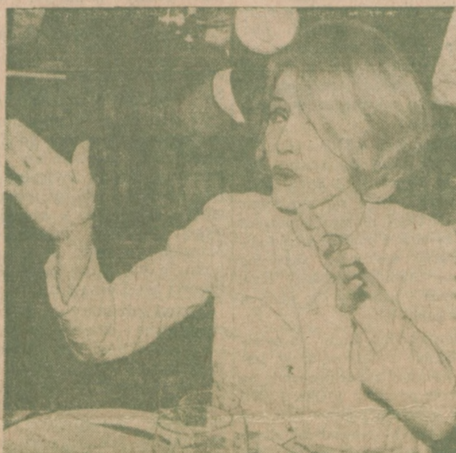
63-LETNIA MARLENE DIETRICH — wyraźnie gestykuluje podczas omawiania swego solo występu jako śpiewaczki po przedstawieniu w Teatrze Lunt - Fontanne w Nowym Yorku.