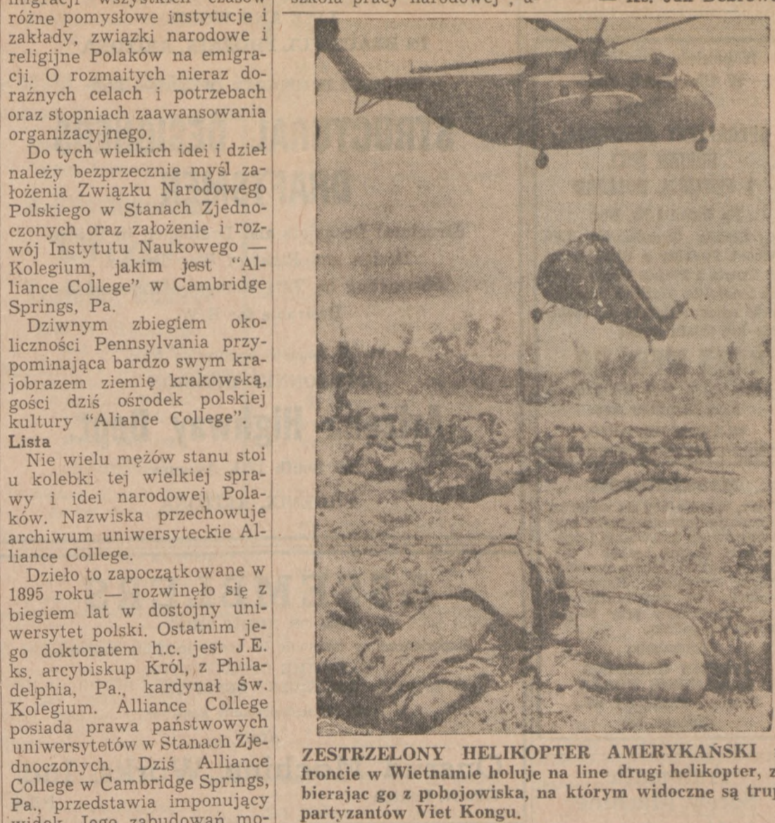
ZESTRZELONY HELIKOPTER AMERYKAŃSKI na froncie w Wietnamie holuje na line drugi helikopter, zabierając go z pobojowiska, na którym widoczne są trupy partyzantów Viet Kongu.

Leinie Kursy Od 6 lat odbywają się tu w okresie letnich wakacji wykłady polonistyczne dla młodzieży z całej Ameryki Północnej. Kursy obejmują również od 30 lat młodzież z high school. Studia tego typu cieszą się wielką popularnością, zarówno wśród młodzieży, jako też społeczeństwa polskiego. Jest to tak zwana "szkoła pracy narodowej", u-