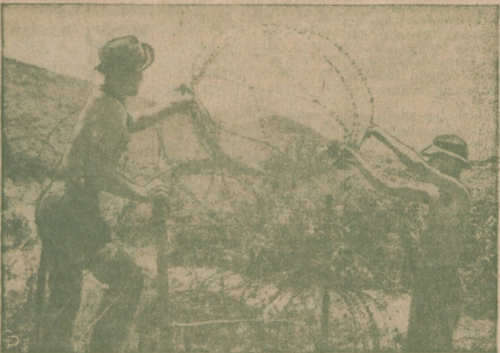
ZASIEKI Z DRUTU KOLCZASTEGO. — Żołnierze Gurkha przygotowują z drutu kolczastego przeszkodę w pobliżu granicy pomiędzy Czerwonymi Chinami i Hong Kongiem, niedaleko wioski Lo Wu. Obszar ten był sceną zabuzen.