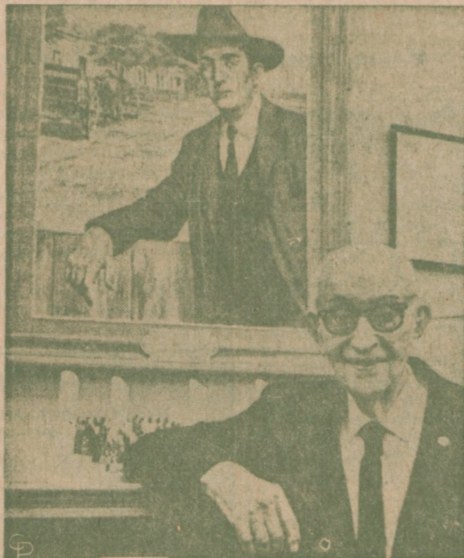
SEN. CARL HAYDEN , D-Ariz., skończył 90 lat. Tłem jego urodzinowego zdjęcia w gabinecie senackim jest portret Haydena jako szeryfa powiatu Maricopa w ówczesnym terytorium Arizony. Funkcję tę pełnił w latach 1906-8. Hayden jest najstarszym członkiem Kongresu, który w Senacie zasiada bez przerwy od roku 1912.