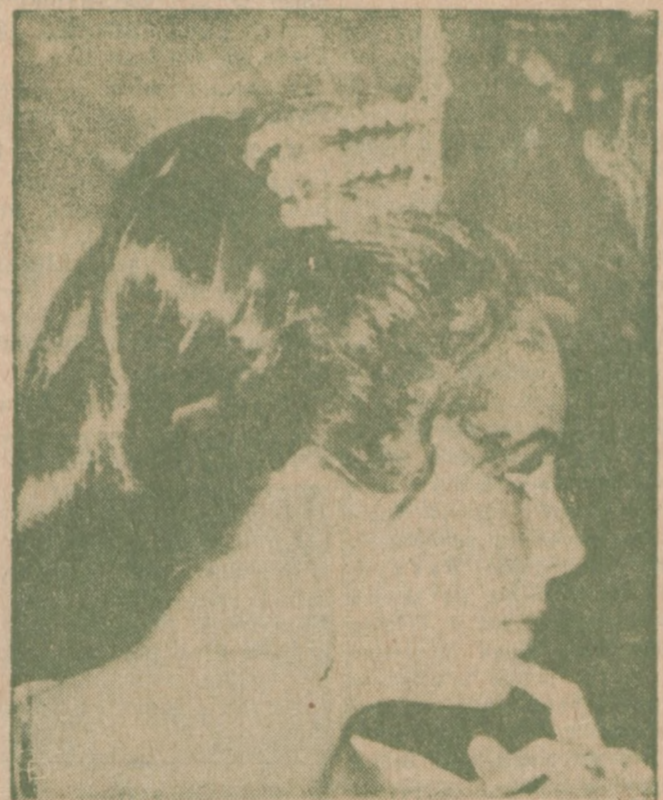
ELIZABETH TAYLOR , dwukrotna laureatka Akademii Filmowej, ma na głowie diadem z brylantów i pereł wartości 1,2 milionów, gdy przybyła w Londynie na premierę filmu, w którym gra główną rolę: "The Taming of the Shrew."