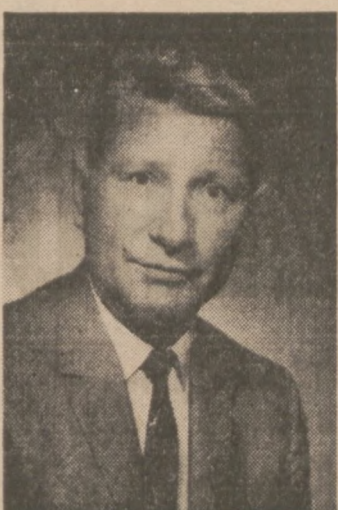
Władysław Dworakowski Cenzor Z.N.P.

Głównym przemówieniem wygłosi na Akademii mec. Władysław Dworakowski, Cenzor Związku Narodowego Polskiego i jeden z czołowych przywódców młodszego pokolenia Polonii. Przybędzie on specjalnie do Chicago, żeby wraz