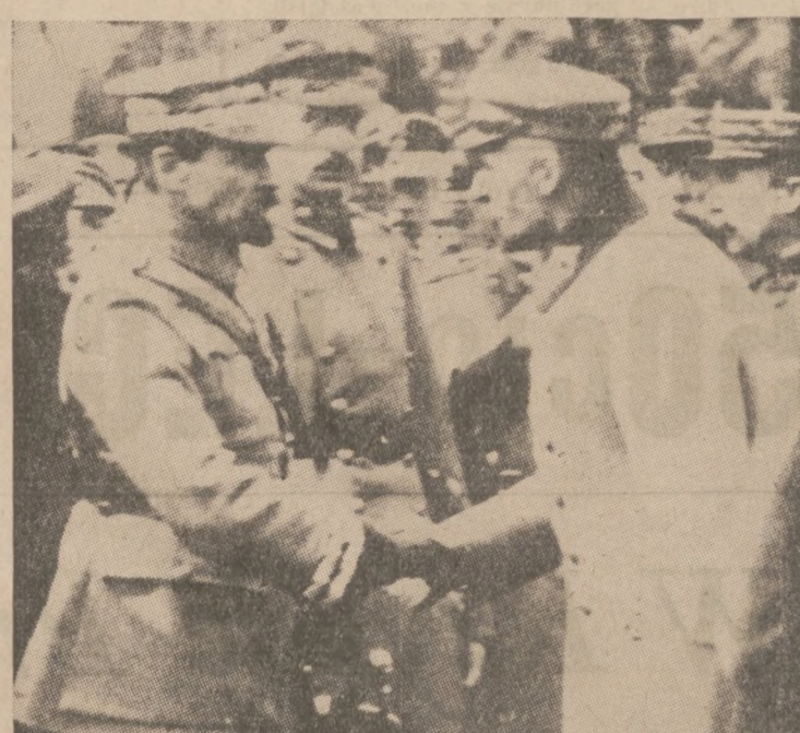
Gen. Józef Haller wita się z Marszałkiem Józefem Piłsudskim w Warszawie, zaraz po swym przybyciu do stolicy Polski z Armią Błękitną.

Naród Polski podbity z końcem 18. wieku przez trzech przemożnych sąsiadów nigdy nie pogodził się z utratą swej wolności i własnego państwa. W wieku 19ym coraz to podnosił broń przeciw zaborcom czy to w legionach Dąbrowskiego po stronie Napoleona, czy w powstaniach w latach 1830, 1846, 1863. Gdy po klęsce ostatniego powstania było już niewątpliwie widoczne, że samodzielnym wysiłkiem zbrojnym nie jest możliwe pokonanie potęgi choćby jednego tylko z okupantów — naród polski mimo to nie ugiął się, lecz wytrwale dążył i przygotowywał się do odzyskania niepodległości, oczekując na stosowną międzynarodową sytuację polityczną, która by pozwoliła na realizację tego celu.