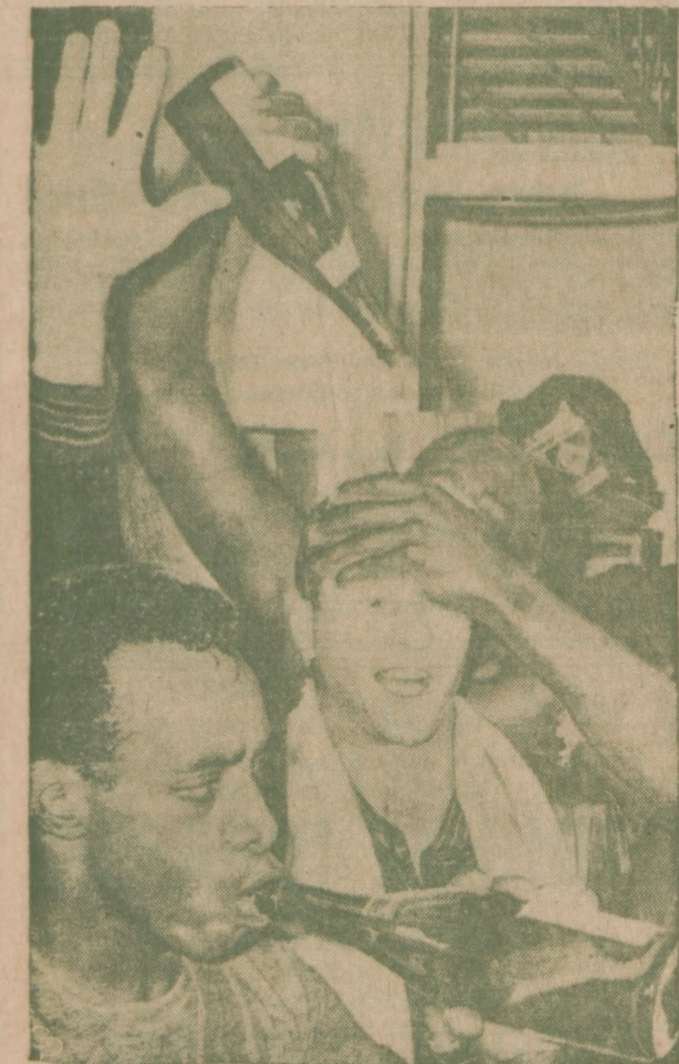
KAROL JASTRZEMSKI (po prawej), jeden z graczy Boston Red Sox celebrytuje zwycięstwo nad zespołem Minnesota 5-3 w Bostonie. Głowę Jastrzemskiego jeden z jego kolegów polewa szampanem, zgodnie z przyjętym w takich wypadkach zwyczajem.