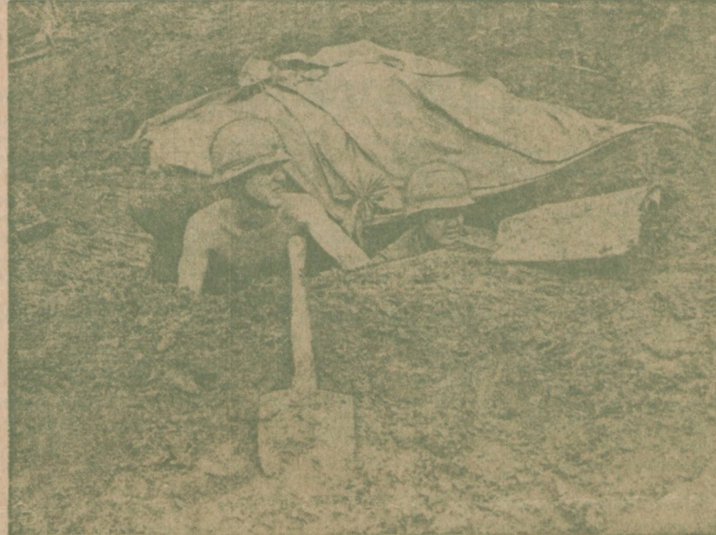
CZEKAJĄ NA NASTĘPNY ogień zaporowy — Dwóch żołnierzy amerykańskiego Korpusu Marynarki zagląda ze swej pozycji wykopanej w ziemi w Con Thien, Połudn. Wietnam, gdzie spodziewają się następnej zapory od artylerii północno-wietnamskiej, będącej w Strefie Zdemilitaryzowanej.