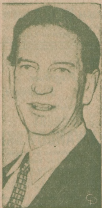
SUPER SZPIEG sowiecki w Anglii Harold (Kim) Philby w ciągu 34 lat, gdy działał jako wysoki urzędnik brytyjskiej służby wywiadowczej zanim uciekł do Moskwy cztery lata temu. Ostatnio odwiedził go tam syn, który opowiedział w Londynie wszystko, co usłyszał od ojca, wywołując wielką sensację — tak w Wielkiej Brytanii jak i Stanach Zjednoczonych. Z tytułu swych funkcji w brytyjskiej centrali wywiadu Philby był bowiem łącznikiem z CIA.