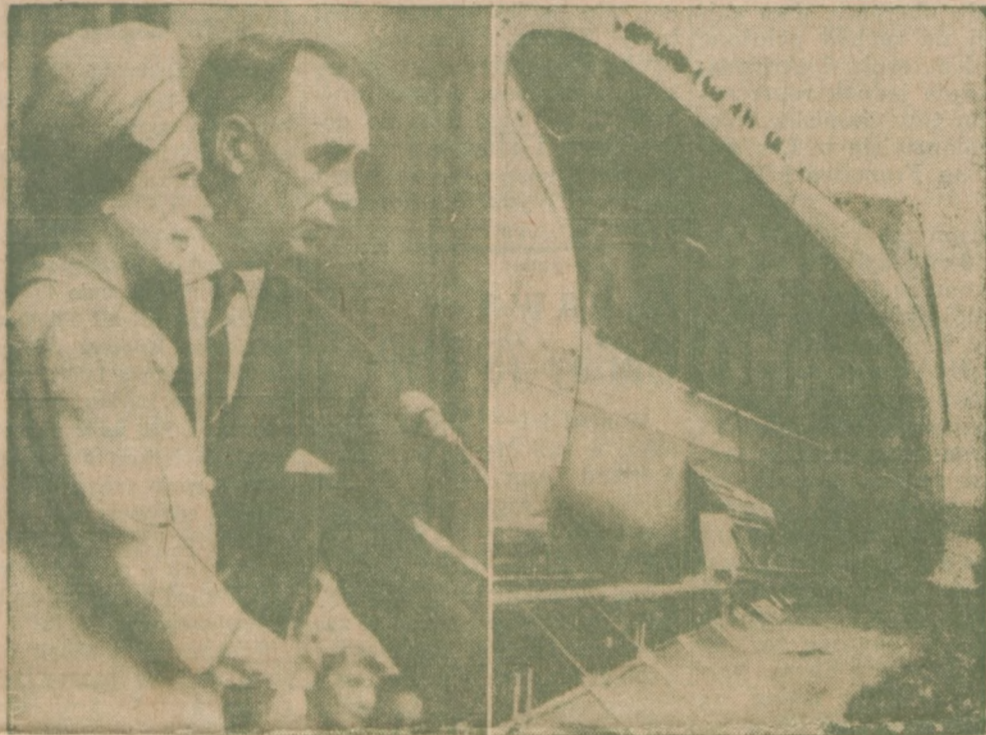
KROLOWA ELŻBIETA II naciska guzik urzędzenia, spuszczającego na wodę na rzece Clyde w Szkocji nieukończony jeszcze wielki statek pasażerski nazwany jej imieniem.