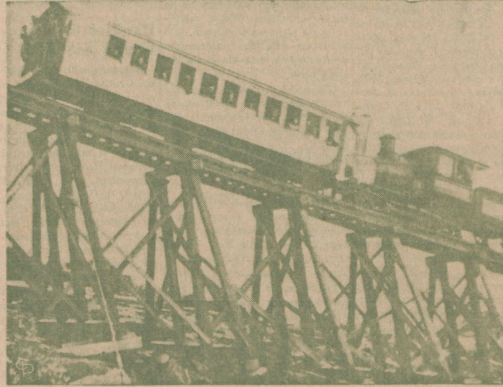
POCIĄG KOLEJKI ZEBATEJ wyskoczył ze swego toru w drodze na Mt. Washington w Nowej Anglii. 8 osób poniosło śmierć, a 71 ciężkie obrażenia.