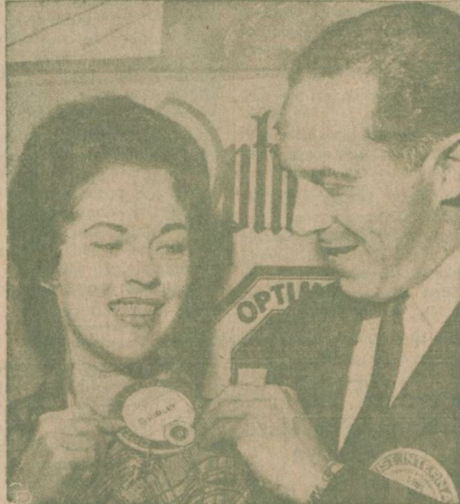
PROWADZI KAMPANIĘ — Shirley Temple Black, republikańska kandydatka do Kongresu podczas specjalnych wyborów uzupełniających, otrzymuje od dra Kenneth C. Stergion w San Mateo, California — guzik Klubu Optymistycznego po przemówieniu do członków tego klubu. Jej kampania polega przeważnie na wygłaszaniu 10 i 15 minutowych przemówień na nieformalnych zebraniach gospodyń i byznesmanów.