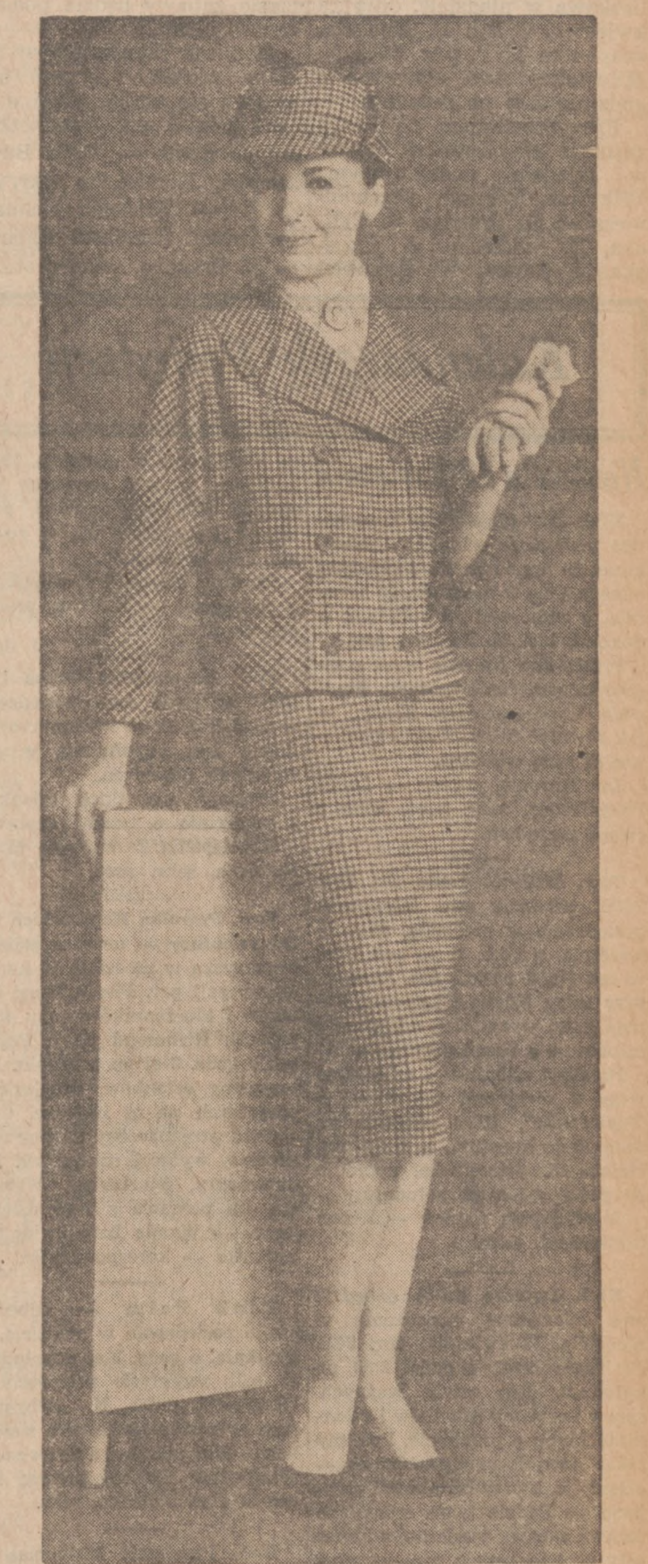
Kostium wiosenny z wełny w kratkę czarno-białą lub beżowo-brązową.