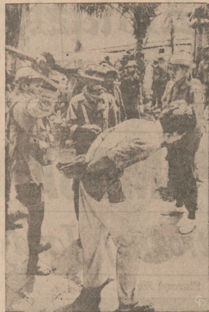
PODEJRZANY O NALEŻENIE DO WIETKONGU — Kambodżański żołnierz przygotowuje się do uderzenia kolbą mężczyzny, podejrzanego o należenie do partyzantów Wietkongu w mieście Ang Tasm, które wcześniej zaatakowały wojska komunistyczne.

Konwencja UAW uchwalała pobierać podwójne składki członkowskie w ostatnich czterech miesiącach przed wygaśnięciem kontraktu. Nie jest to jednak podwójne opodatkowanie, lecz wcześniejsze pobieranie składek na wypadek strajku.