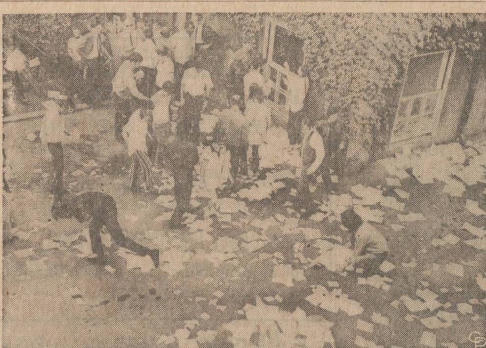
ODŁAM WZOROWYCH STUDENTÓW — Studenci miłujący porządek przybyli na teren Uniwersytetu Carnegie-Mellon w Pittsburghu, celem pozyskania papierów, zaburzonych podczas zaburzeń. Wcześniej, ich pomyleni koledzy wzięli udział w zaburzeniach, podczas których powybijali szyby w budynku ROTC.

Na wicę, jaki się odbył w niedzielę, na którym udział wzięło kilkuset reprezentantów szkół i organizacji, uchwalamo urządzić dalszy masowy wiec w Chicago, w Dzień Wzięcia Grobów. Celem będzie włączenie innych grup, jak robotników, unię, członków grup młodzieżowych, jak Młode Lordy i Latin Kings, byznesistów i żołnierzy.