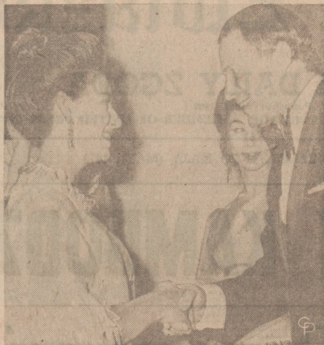
KONCERT NA CELE DOBROCZYNNY — Śpiewak Frank Sinatra wita księżniczkę Małgorzatę, która przybyła do Royal Festival Hall na pierwszy z dwóch, dawanych przez niego, koncertów na cele dobroczynne.