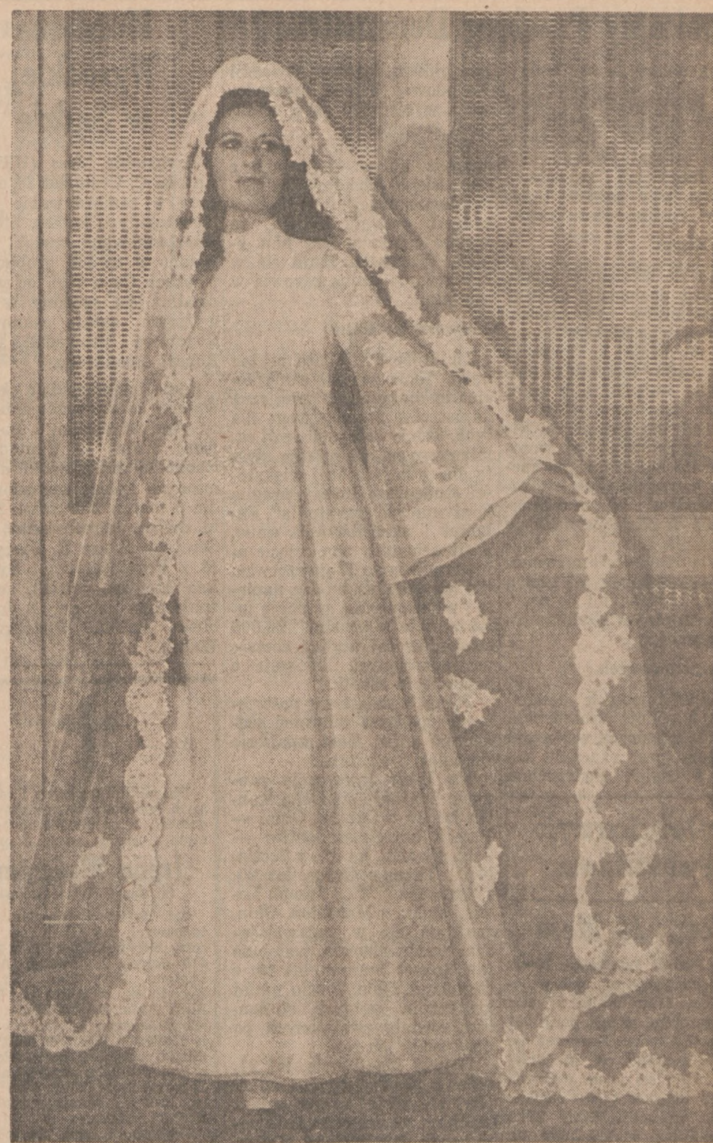
Piękna suknia z białej organdy, welon z francuskiej koronki.