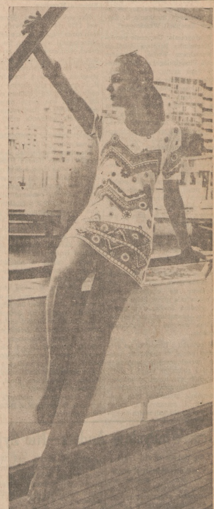
Wzorzysta tunika z krótkimi rękawami, odpowiednia do spodni lub spódniczki. Jersey, lub dacron.