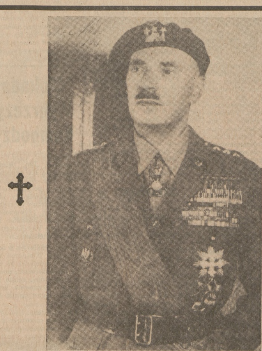
Gen. Broni Władysław Anders

New York (UPI) — Najwyższa temperatura w kraju była notowana wczoraj 97 stopni w Coolidge, Arizona, a najniższa 26 stopni w Burns, Oregon.