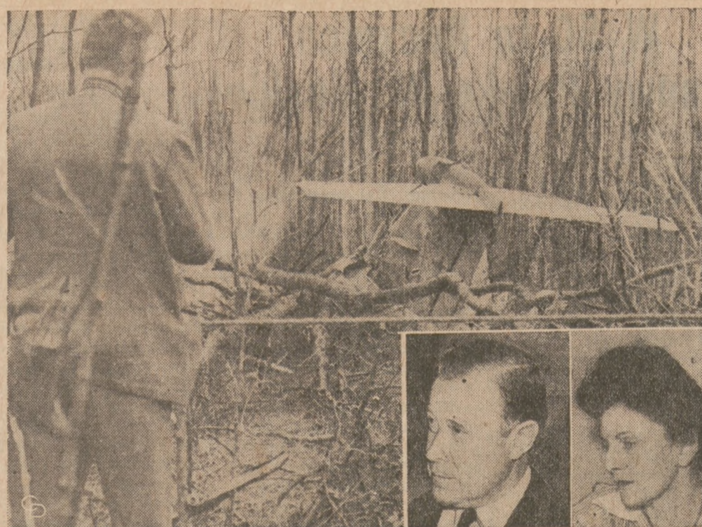
REUTHER I JEGO ŻONA ZABILI W KATASTROFIE SAMOLOTOWEJ. Walter P. Reuther, lat 62, prezes Unii Robotników Samochodowych i jego żona (na wstawionych zdjęciach) stracili życie, gdy wylądowali przez nich samolot odrzutowy rozbił się i zapalił podczas podchodzenia do lądowania na lotnisku w Pellston w czasie deszczu. — Cztery dalsze osoby, które były na pokładzie samolotu, również zostały zabite.