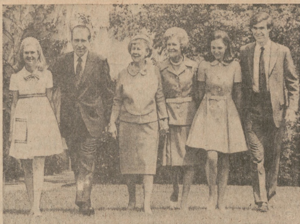
PIERWSZA RODZINA NA SPACERZE. Zdjęcie Pierwszej Rodziny w kraju, która podczas pięknego dnia wiosennego wybrała się na spacer po ogrodzie Róż przy Białym Domu. Od lewej: Tricia; Prezydent Nixon; Mamie Eisenhower; pani Nixonowa, oraz Julie i David Eisenhower.

Podkreślił przytym, iż t. zw. wewnętrzne szkoły katolickie w mieście uzyskały wyniki niższe od ogólnych norm osiągniętych w Arcydiec. szkołach w próbie, w tym roku.