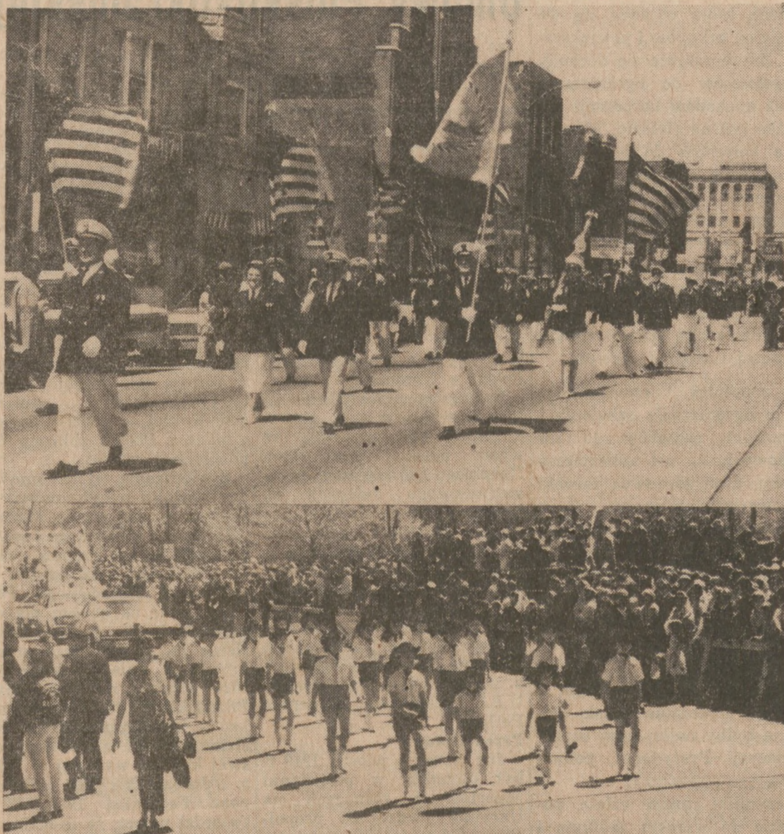
U. góry — Oddział marszowy Ligi Morskiej w Ameryce, który swą dziarską postawą i wyglądem zdobył I miejsce i nagrodę w Grupie Starszych, w Pochodzie, w tym roku. U. dołu — jedna z grup doskonale się prezentujących oddziału Hegewich Raiders Drill Team PLAV, który to oddział uzyskał I miejsce i nagrodę w kategorii zespołów musztrowych, w Pochodzie.