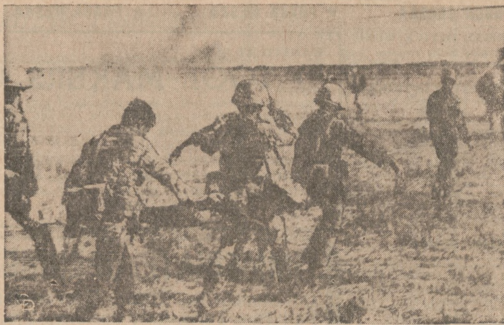
PRZENOSZĄ KOLEGĘ POD OGNIEM. — Ostrzelani przez komunistów, południowo-wietnamscy strzelcy morską przenoszą ранnego kolegę do helikoptera, podczas ciężkiej walki o odciążenie żołnierzy kambodżańskich w mieście Prey Veng.