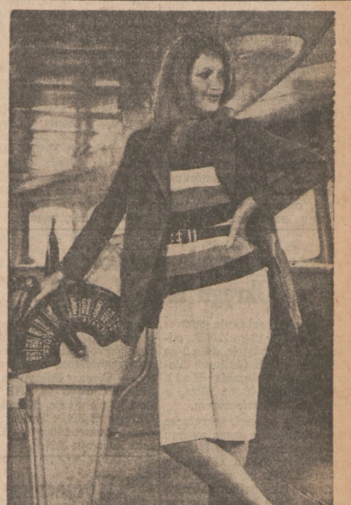
Strój sportowy, odpowiedni do podróży lub na wycieczki — spodnie z białej bawełny (cotton) pulower w pasy biało-niebiesko-granatowe. Zakiet granatowy.