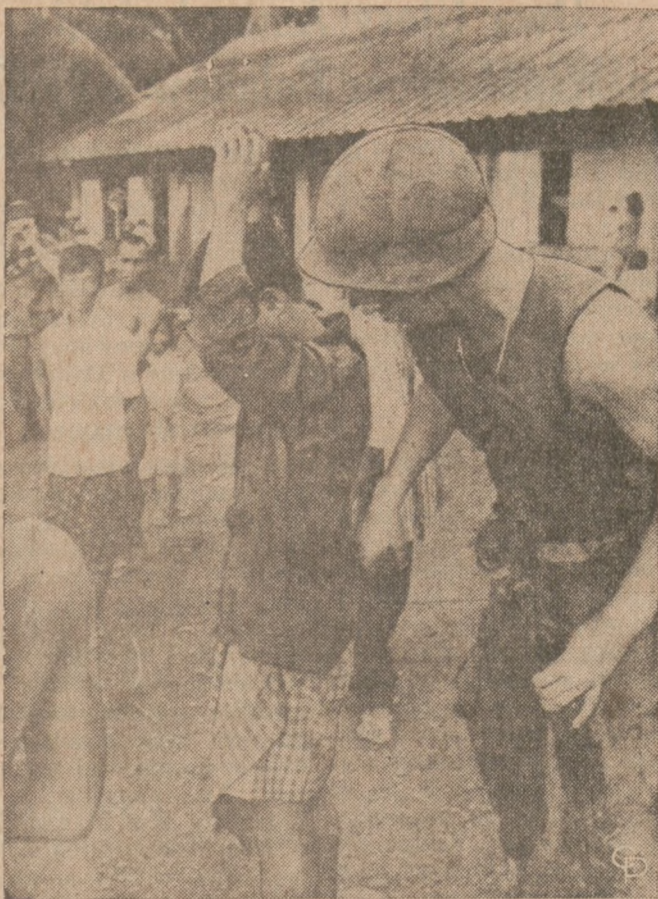
REWIDUJE PODEJRZANYCH — Podczas patrolu na plantacji kaczuki w wiosce Memot, Kambodża, amerykański żołnierz rewiduje osoby cywilne podejrzane o pomaganie partyzantom Wietkong.

Warszawa. — W ub. roku polskie wyroby włókienniczo-odzieżowe po raz pierwszy znalazły się w Japonii. Wartość eksportu polskiego na ten nowy rynek wyniosła na początku pół miliona złotych dewizowych. Japońskie firmy zakupiły m.in. płaszcze damskie, firanki, koce i dywany. W roku ub. przemysł odzieżowy opracował specjalną, atrakcyjną kolekcję sukienek i innych ubiorów kobiecych dla japońskich klientów.