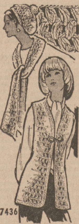
7436 by Alice Brooks

New! Layer-look long vest over skirts and pants! JIFFY trio! Crochet smazzy vest, scarf, hat in fluffy puff stitch using knitting worsted, No. 8 plastic hook. Pattern 7436: scarf, vest, NEW sizes 10-16 incl. Cap. S, M, L, incl.