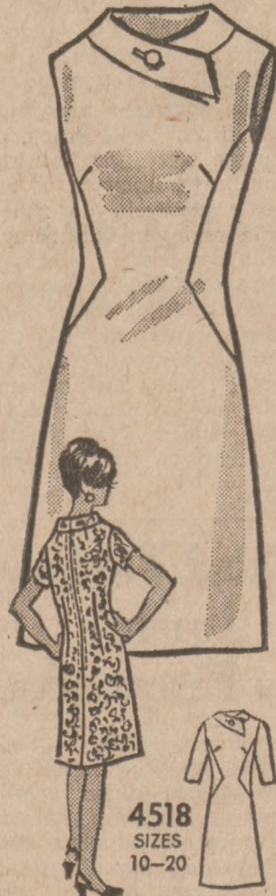
4518 SIZES 10-20 by Anne Adams

This seam-angled skimmer makes you look wonderful from every angle. You'll love the standaway band neckline, buttoned, then flipped free.