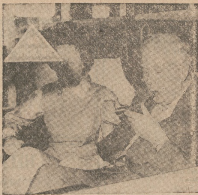
ROZPOCZYNA KAMPANIĘ WYBORCZĄ. — Brytyjski premier Harold Wilson wraz z żoną Mary udaje się pociągiem do Walii, celem otwarcia kampanii wyborczej.

US popierały i pomagały armii południowokoreańskiej w ciągu 20-tych lat i ekspedycji wojakowi US uważają armię koreańską za bardzo dobre wojsko, zdolne do utrzymania się w wypadku zagrożenia ze strony Płn. Korei.