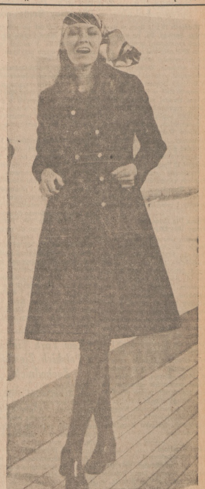
Plaszcz wiosenny między mini i midi, z welnianą gąbrydą w kolorze granatowym lub czarnym.