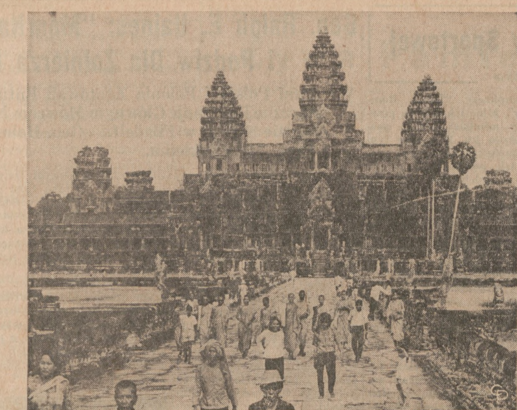
ANGKOR WAT. — Zdjęcie części ruin Angkor Wat, kambodżańskich wielkich wio- dych świątyni, położonych około 150 mil na północny - zachód od Phnom Penh i wy- mienianych często w komunikatach wojennych.

Pamiętaj, że wobec zmuszenia narodu pol- skiego, do milczenia, "Dz. Związkowy" jest jedynym jego wolnym głosem.