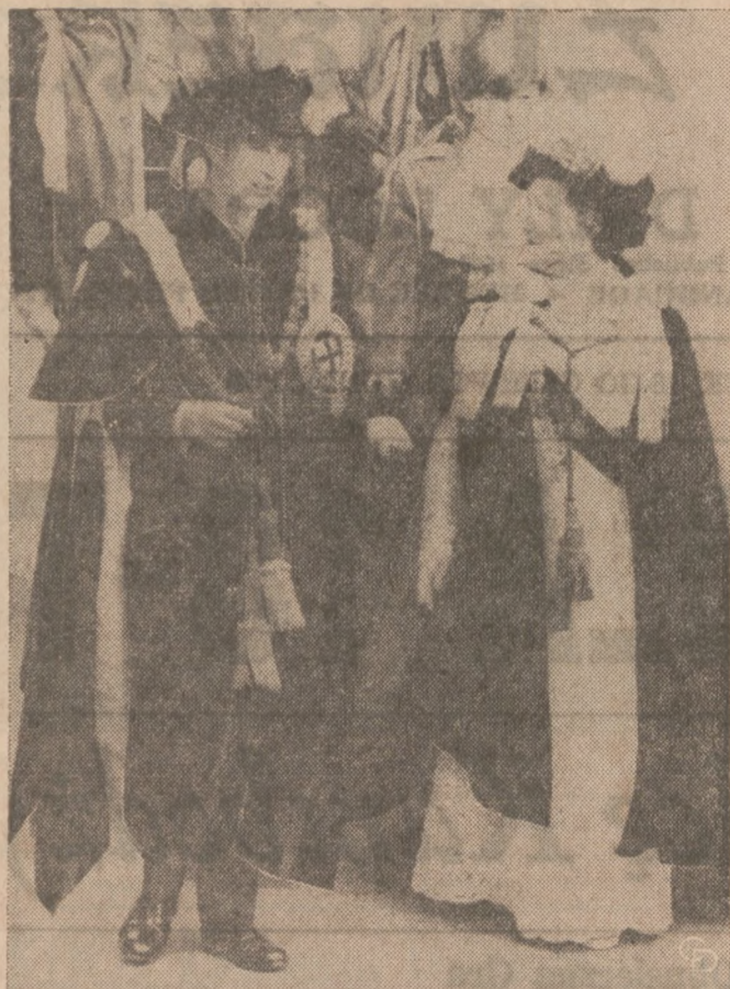
PROCESJA KRÓLEWSKA — Księżę Walii Karol maszeruje ze swą babką, królową Elżbietą, do zamkowej kaplicy w Windsor, gdzie jego matka, królowa Elżbieta II, obdarzyła czterech nowych arystokratów tytułami kawalerów Orderu Podwiązki (Garter Order).

Którzy Ogłaszają Się w Dzien. Związkowym