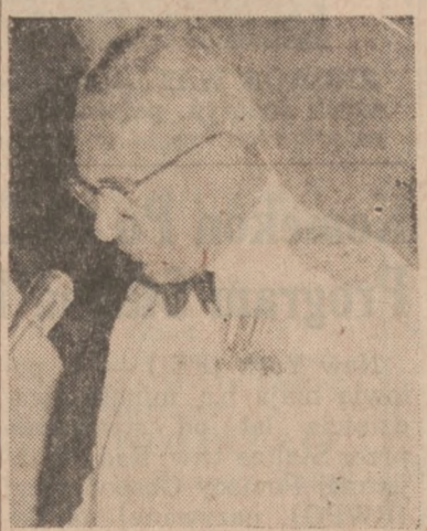
General Ralph E. Haines, Jr. w Galowym Mundurze Armii U.S. Wygłasza Mowę na Bankiecie

"Dzieje się to w tym samym czasie, gdy najbardziej krzykliwe jednostki wzywają nas abyśmy zapomnieli o tych wzniosłych wartościach, a nawet usiłują położyć cień na służbie w naszych siłach zbrojnych".