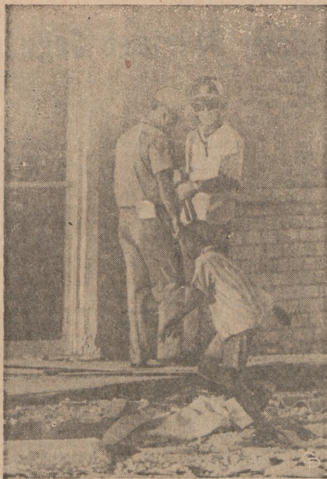
WYKORZYSTAŁ ZABURZENIA — Policjant i strażak patrzą jak chłopiec murzynski ucieka z kolonialnego sklepu, podpalonego podczas zaburzeń w przeważającym murzyńskiej dzielnicy w Des Moines, Iowa. Co najmniej 20 osób doznało porażeń. Do zaburzeń doszło, gdy zbiegły więzień został zabity.