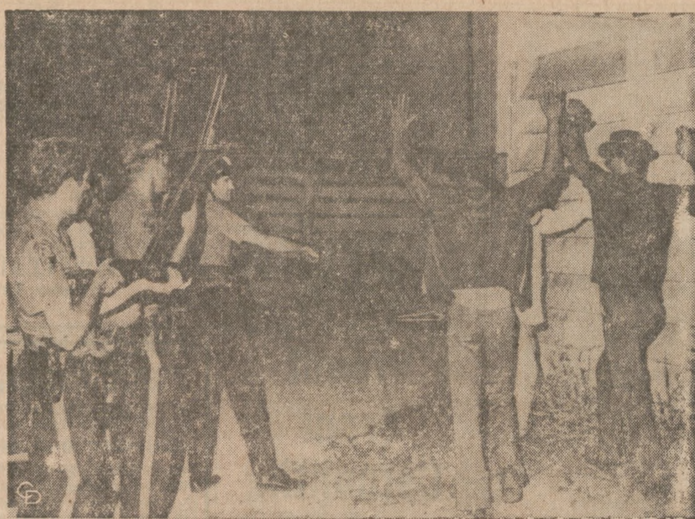
PODEJRZANI O PODRZUCENIE BOMBY UJĘCI — Policja ujęła trzech mężczyzn podejrzanych o podrzucenie bomb zapalnych podczas zaburzeń w Miami, Fla.

W wywiadzie dla prasy, jaki miał potem Jackson po zebraniu powiedział, iż daży do czysto murzyńskiej policji i systemu sądowego do załatwiania spraw dotyczących Murzynów. Wielu z ludzi może uważać to za rasizm — mówił Jackson, ale jeśli działa w Cicerro i Gage Park dla białych, dlaczego nie mógłby taki system działać w Chicago, w odniesieniu do Murzynów. Murzynów sędziowie znający lepiej środowisko murzyńskie — łatwiej mogliby zrozumieć murzynów jak biali sędziowie, a czysto murzyńskie sądownictwo łatwiej mogłoby osiągnąć odpowiedniość do rzeczywistości murzynów. Niektórzy z Murzynów powinni być w więzieniu i tak jak biali sędziowie skazują białych morderców, czarni sędziowie skazywali by niektórych murzynów — dokończył Jackson.