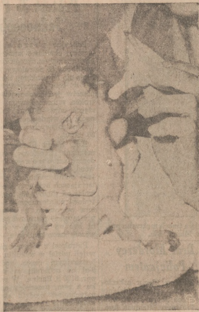
KŁOPOTLIWA MALPA — Dozorca karmi w ogrodzie zoologicznym w Cincinnati małpkę, która przyszła na świat 23 maja. Małpka ta waży tylko 4 uncje.