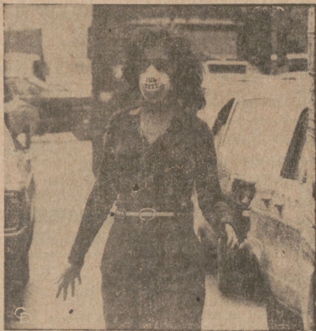
JAKBY W DZIEŃ WILKOŁAKÓW — Po ulicach New Yorku ludzie chodzą w maskach ochronnych przeciwko “smogowi”, co wygląda, jakby to był Dzień Wilkołaków. Takie maski zalecił i wydał mayor New Yorku John Lindsay.