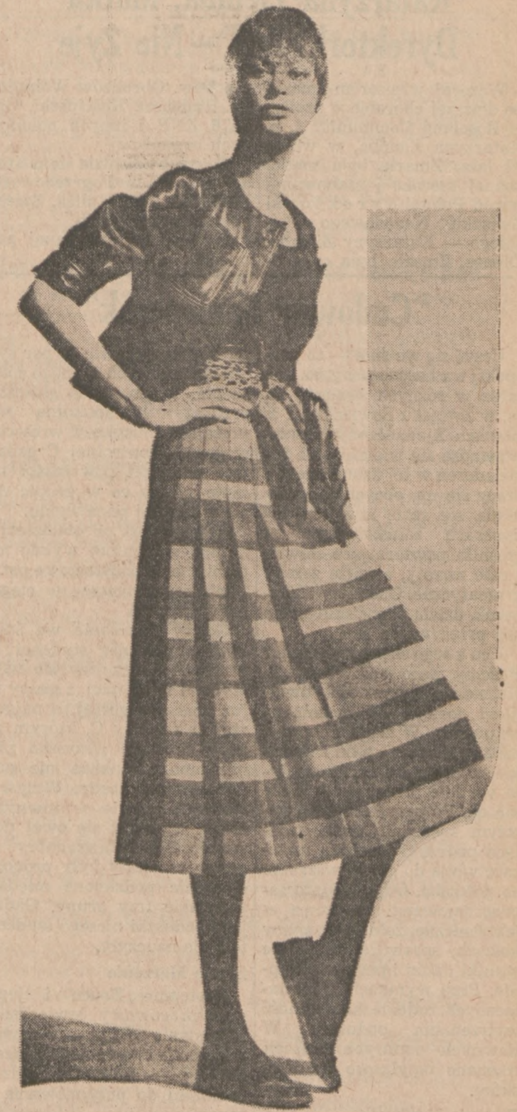
Modny komplet jesienny — wełniana spódnica (popielato czarna), czarna bluzka bez rękawów i skórzany żakiet w czarnym lub popielatym kolorze.