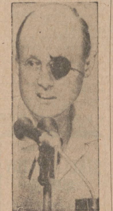
INTERWENCJA IZRAELA — Moshe Dayan, minister obrony Izraela oświadcza parlamentarnej Kneses w Jeruzalem, iż przybliżenie stanowisk sowieckich baterii rakietowych na odległość 120 mil od kanału Suezkiego przez Egipt — w okresie 90 dni zawieszenia broni jest pogwałceniem rozejmu. Dayan powiedział, iż odpowiedzialność za usunięcie tych baterii na poprzednich miejscach spoczywa na Stanach Zjedn.

Zamówienia wraz z należnościami nadsyłać należy: DZIENNIK ZWIĄZKOWY 1201 Milwaukee Ave. CHICAGO, ILLINOIS 60622 C.O.D. nie wysyłamy