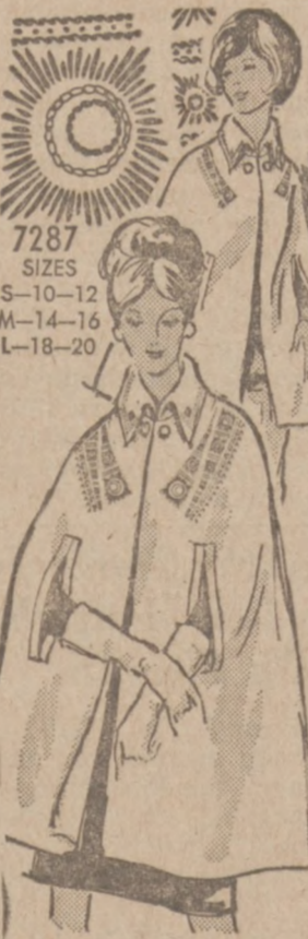
by Alice Brooks

Travel from city to campus to suburbs in a smart cape. SEW — Easy cape — wrist or ¾ length, with or without embroidery! For wool, blends, Pattern 7287: transfer, printed pattern S(10-12); M (14-16); L(18-20). State Size.