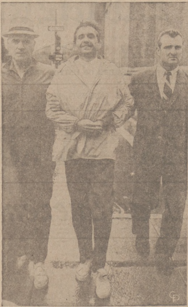
PASTOR DANIEL J. BERRIGAN traktuje całą sprawę z uśmiechem. Berrigan, lat 49, został aresztowany przez agentów FBI (na zdjęciu zaraz po aresztowaniu) i zostanie osadzony w więzieniu w Lewisburg, Pa., gdzie spędzi, zgodnie z wyrokiem sądu 3 i pół roku, za zniszczenie dokumentacji wojskowej komisji poborowej.

Mimo wielkich bogactw, jakimi dysponował (roczne dochody z eksploatacji złóż ropy naftowej wynosiły 75 mln dolarów) ibn Tajmur był niezwykle skąpy. Nie dawał pieniędzy nawet najbliższej rodzinie, od której zresztą się zupełnie odeprowadził. Syn, który go obalili, znajdował się od 4 lat w areszcie domowym. Nie dopuszczał do siebie również przywódców szeregów mieszkających w Maskacie i Omanie. Uлюбioną lekturą ibn Tajmura było czasopismo "Playboy".