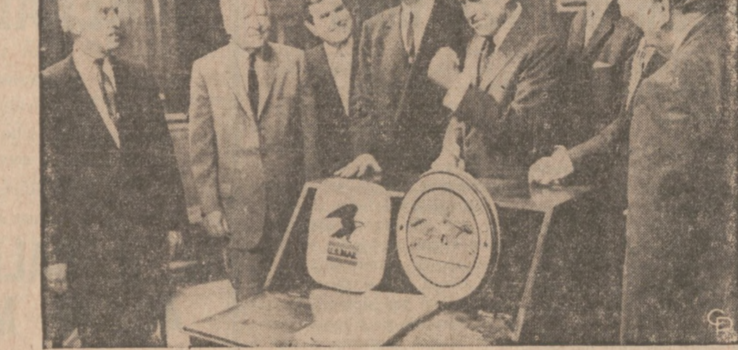
REFORMA POCZTY — Prezydent Nixon w otoczeniu wysokich urzędników pocztowych poje do zdjęcia po podpisaniu ustawy reorganizującej służbę poczty. Również widoczne na zdjęciu u dołu nowe insygnium poczty (po lewej), przedstawiające orla oraz stara pieczęć z jeźdźcem.