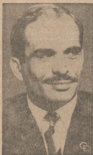
KRÓL JORDANII, Hussein (na zdjęciu) już po raz drugi wyszedł cało z zamachu na jego życie. Tym razem wystrzelono w kierunku jego eskorty pocisk przeciwlotnicowy w pobliżu portu lotniczego w Ammanie gdzie król udawał się na spotkanie z córką. Hussein ma obecnie 34 lata.

Elektrownia szczytowo-przepompowa na górze Żar prawdopodobnie zapoczątkuje budowę całej serii tego typu obiektów w Polsce. Kto wie, czy druga taka elektrownia nie stanie po przeciwnej stronie jeziora w Porąbce?