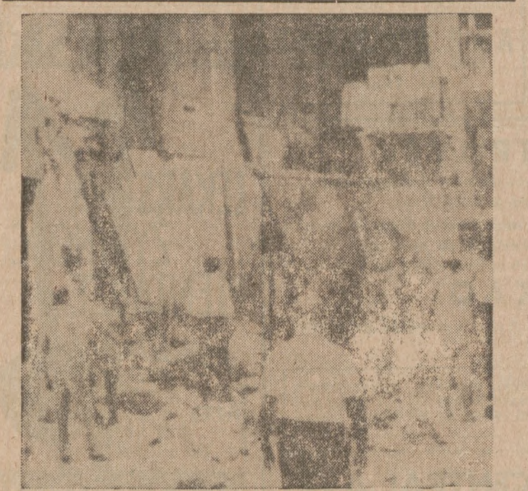
MIESZKANCY WŁOSKIEGO MIASTA PEDASO zgrozili, widząc ruin zniszczonego hotelu wskutek silnej eksplozji gazu kuchennego. Osiem osób poniosło śmierć.

Zamówienia prosimy nadsyłać: DZIENNIK ZWIĄZKOWY