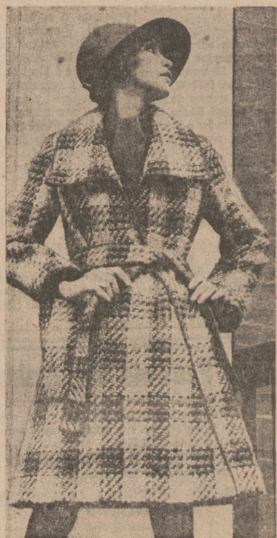
Modny płaszcz wełniany w kratę biało-czarno popielata.

Po śmierci Schlee, Greta znowu prowadzi życie samotne, nie bywa nigdzie poza szczupłym gronem przyjaciół. Gwiazdy filmowe wschodzą i zachodzą. Pamięć o tych, które zgasiły nie trwa długo. Greta Garbo jest wyjątkiem, niezwykłą królową filmu, na miejsce której dotąd, w 29 lat po abdykacji, nie ma godnej następczyni.