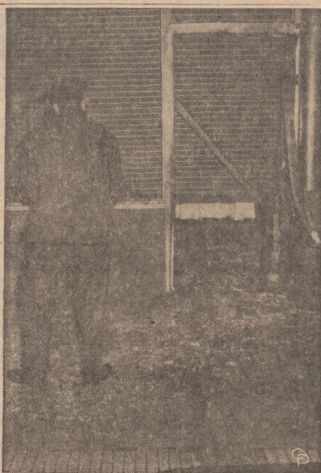
NA ZDJĘCIU: nowojorski policjant bada miejsce wybuchu bomby podłożonej przez portorykańskich nacjonalistów pod gmachem biurowym General Electric Co. W wyniku eksplozji zniszczeniu uległy biura na parterze. Przechodząca ulicą kobieta została lekko ranna uderzona odłamkiem cegły.

NOWE OBUWIE DLA MĘŻCZYZN I CHŁOPCÓW Najwyższej jakości — "Czechosłowacka Made" — po cenach hurtowych. Otwarte: Wtorek, środa, czwartek, sobota, niedziela. 1819 W. MONTROSE AVE. (Naprz. stacji kolejki Ravenswood)