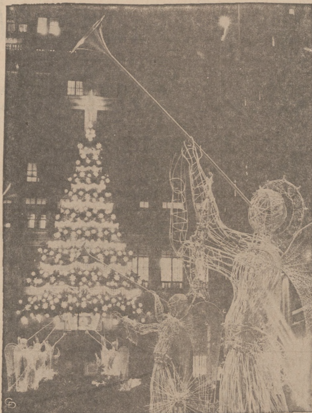
SURREALISTYCZNE ANIOŁY z Rockefeller Center w Nowym Yorku obwieszają światu swymi fanfarami nadejście Świąt Bożego Narodzenia. Na drugim planie świecła choinka przyozdabia gmach domu towarowego Saks Fifth Avenue.

Podnieść rączkę Boże dziecię — błogosław Ojczyznę miłą! Spójrz łaskawie na ziemię mogiła i krzyży, przesiąkniętą krwią, łzami i potem, i lud, który nade wszystko ukochał Wolność i Prawdę. Rozgrzej serca wszystkich Polaków na świecie, dodaj nam mocy, byśmy nie ulegali kuszeniom czerwonego szatana i zdobyli się na jedność myśli i czynów!