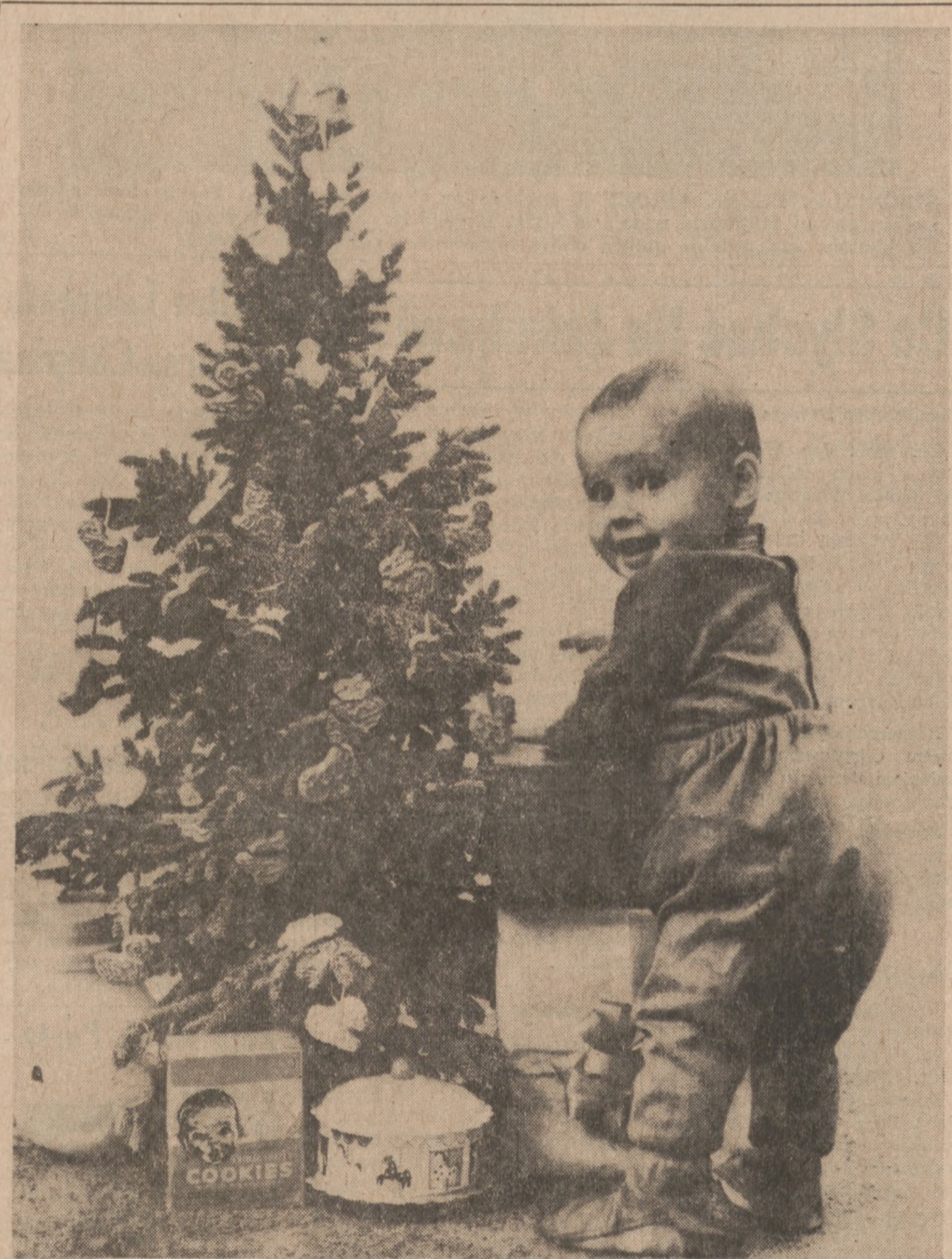
W CZASIE ŚWIĄT NAJWIĘCEJ WRAŻEN CZEKA MILUSINSKICH.

Berlin. (UPI) — Mayor zachodniego Berlina, — Klaus Schuete polecił mieszkańcom, w noc wigilijną, wystawić w oknach zapalone świeczki, jako dowód solidarności z tymi, którzy znajdują się po drugiej stronie muru Ulbrichta i nie mają możliwości odwiedzenia swych krewnych i przyjaciół w wolnym mieście.