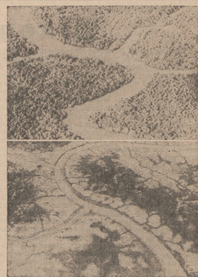
NISZSZE ZDJĘCIE przedstawia fatalne skutki działania broni chemicznej na odcinku leśnym w odległości 60 mil od Sajgonu, Pld. Wietnam, który spryskano z samolotu środkami chemicznymi. Powyżej: zdjęcie innego odcinka tego samego lasu, którego nie poddano działaniu broni chemicznej. Naukowcy twierdzą, iż w ten sposób w Wietnamie zniszczono plony żywnościowe zdolne wyżywić 600,000 ludzi przez cały rok.

Moscow (UPI) — Ludmilla Turisheva, 18-year-old Russian world gymnastics champion, has been named top sportswoman of the year in an international poll organized by Tass, the Soviet press agency. Sports writers from