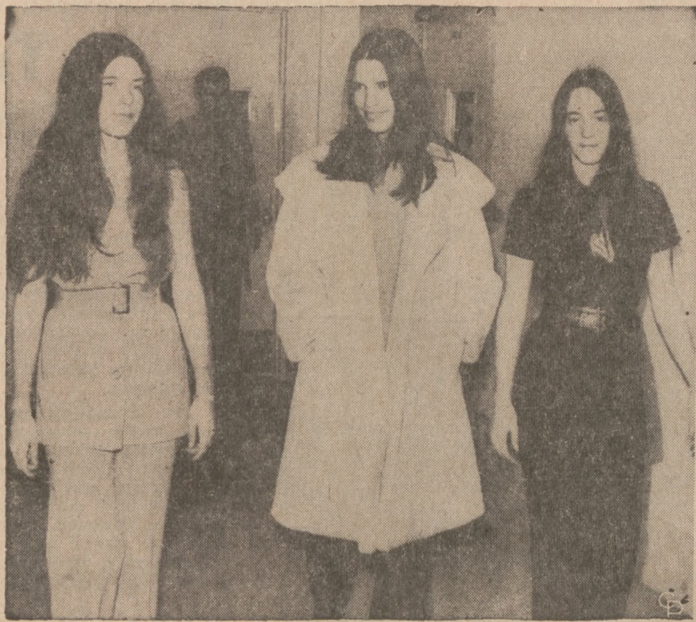
PROCES "TATE-LABIANCA" — dobiega końca. Na zdjęciu: współoskarżone swego "mistrza" Charles'a Mansona, Patricia Krenwinkel (po lewej) Leslie Van Houton (w środku) oraz Susan Atkins w drodze na salę rozpraw, z której zostały poprzednio usunięte na polecenie sędziego ze względu na niewłaściwe zachowanie.

ELVIS JAKO DRUŻBA — Znany aktor i piosenkarz Elvis Presley w życiu prywatnym wystąpił niedawno w roli drużby na ślubie jednego ze swoich strażników osobistych. Na zdjęciu Elvis opuszcza salę sądu gdzie odbyła się uroczystość. Swym ekstrawaganckim wyglądem przypomina Elvsa sprzed 10-ciu lat, u początków swojej kariery, kiedy wybuchł szalony rock and roll.