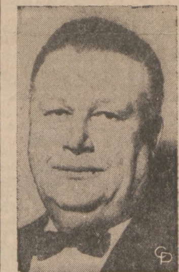
MAYOR SENIOR — Orville Hubard, lat 67, rozpoczął 30 rok pracy na stanowisku mayor w Dearborn, Michigan. Jest to absolutny rekord piastowania tego urzędu w całym kraju.