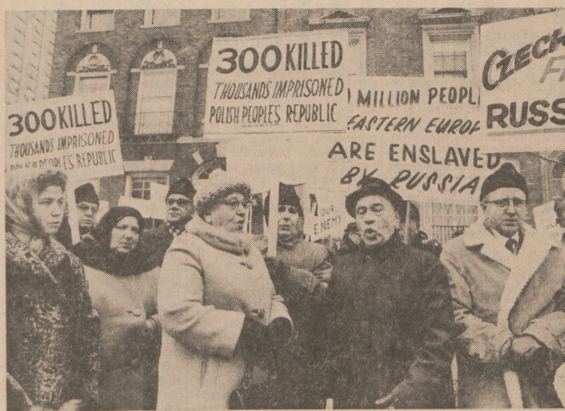
Z demonstracji przed reżymowym konsulem na ul. Astor w dniu 28 grudnia, 1970 r.