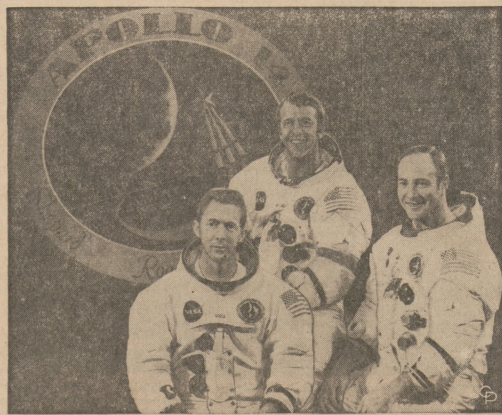
ZALOGA STATKU kosmicznego Apollo 14 pozuje do zdjęcia przed swoim emblematem w ośrodku badań przestrzennych na Florydzie. Od lewej: Stuart Roosa, pilot rakiety; Alan Shepard, dowódca załogi; oraz Edgar Mitchell, pilot modułu księżycowego, który osiadł na Srebrnym Globie.