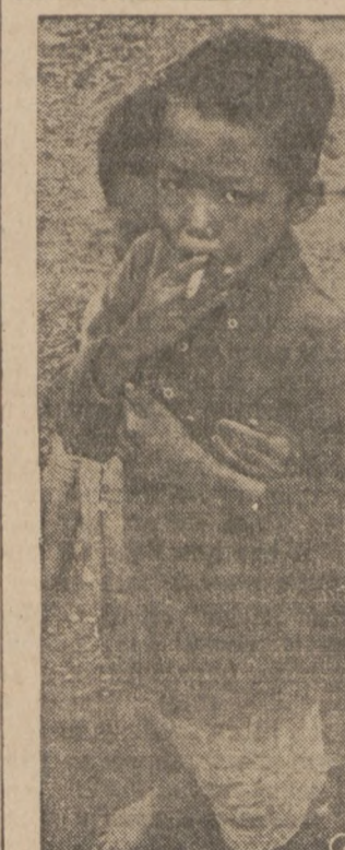
PŁD. WIETNAM — Ci mali chłopcy, bracia zamieszkali w Da Nang, z pewnością nie styśleć dydaktycznych ostrzeżeń przed skutkami palenia papierosów — i to jeszcze w tym wieku!