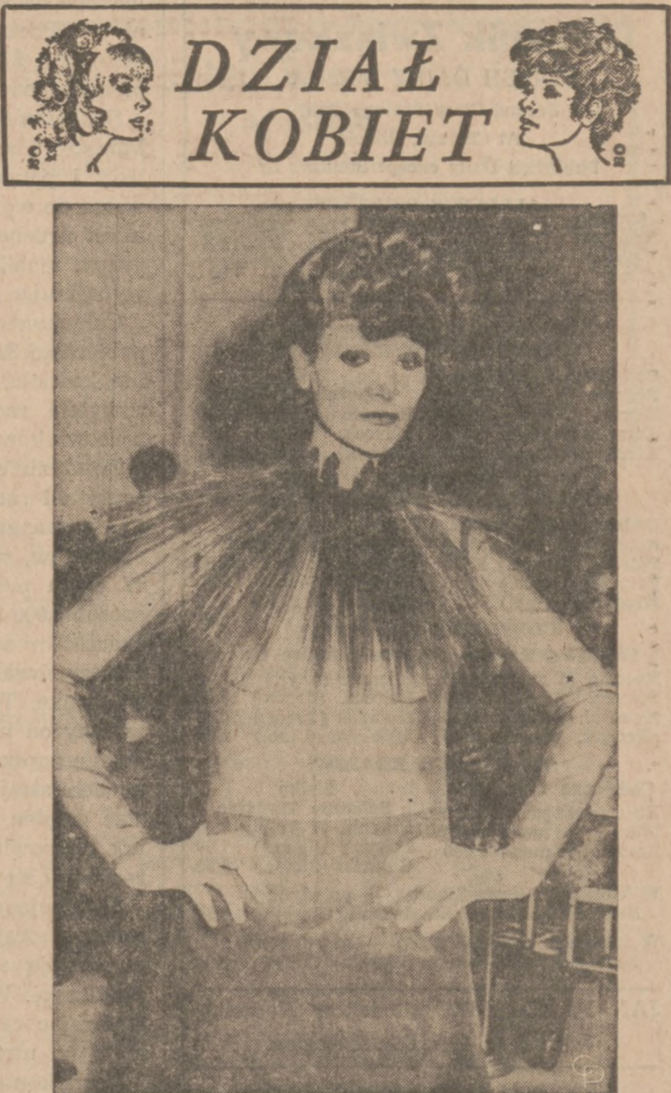
Kreacja Roberto Capucci — Długa spódnica z mory i przezroczysta bluzka. Kołnier z piór.

„NIEBIESKO - CZARNI” wystąpią w Chicago w sobotę, dnia 20 lutego, o godzinie 7:30 wiecz. oraz w niedzielę, dnia 21-go lutego, o godz. 3-jej po południu, w sali LANE TECH. AUD., Western róg Addison.