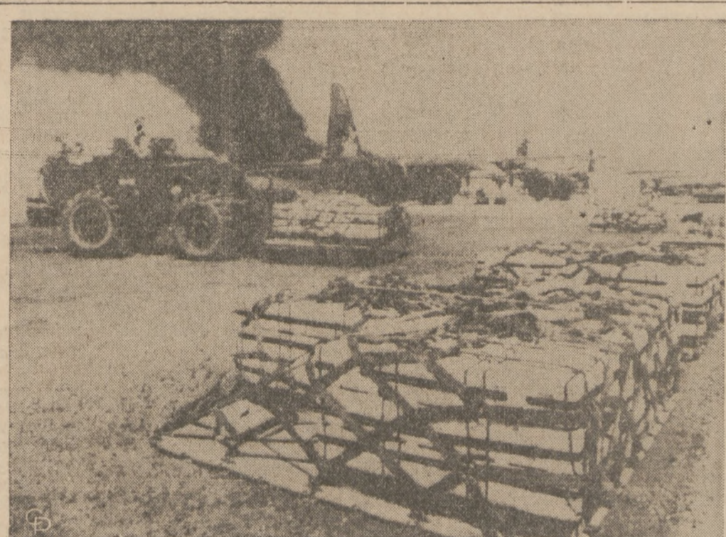
W RAMACH militarnej pomocy dla Kambodży w ciągu ostatnich 10-ciu tygodni przekazano dla armii kambodżańskiej 1,400 ton broni i amunicji oraz 22,000 galonów paliwa. Na zdjęciu: amerykański samolot Hercules C-130 w Tan Son Nhut, Pld. Wietnam, oczekuje na załadowanie amunicji i broni, która zostanie przewieziona do stolicy Kambodży, Phnom Penh.