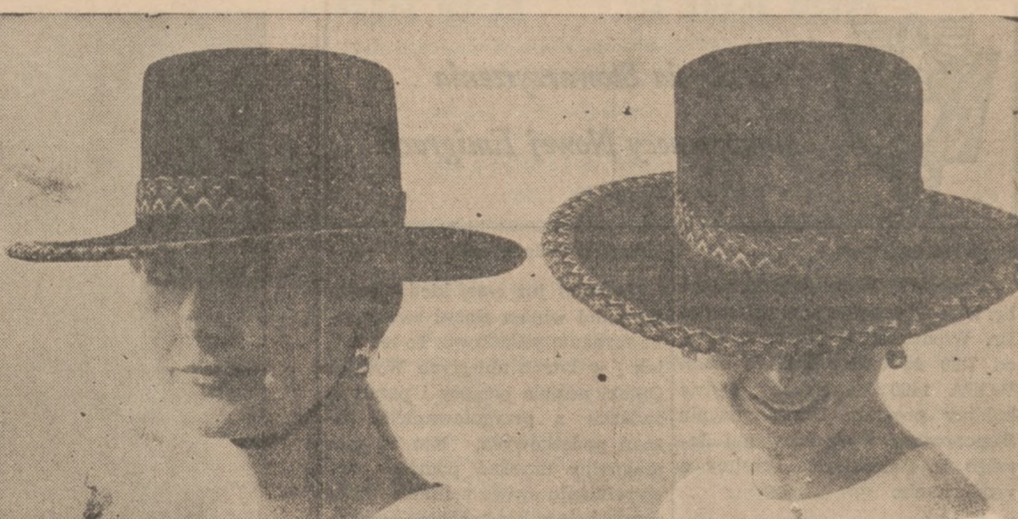
Kapelusze w stylu hiszpańskim, modne przed dwoma laty będą noszone także w nadchodzącym sezonie wiosenno-letnim. Na zdjęciu: model Betmar, w czarnym kolorze.

Nauczyciele głosowali za przystąpieniem do pracy w szkołach w "model cities", w dniu 1-marca, jeżeli władze federalne nie wstrzymają pomocy finansowej dla miasta.