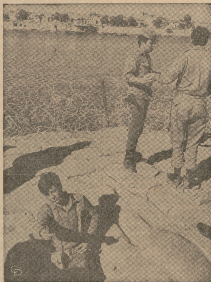
NA ZDJĘCIU: izraelscy żołnierze przed fortyfikacjami wzdłuż Kanalu Sueskiego w miejscowości Qantara.

• KUPUJĄCE W SKŁADACH • KTÓRE OGŁASZAJĄ SIĘ W DZIENNIKU ZWĄZKOWYM