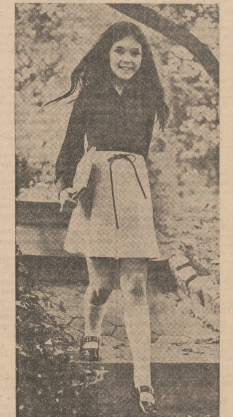
Komplet wiosenny dla dziewczynki: granatowa bluzka jasna plisowana spódniczka i pasek zamszowy, w kolorze granatowym.