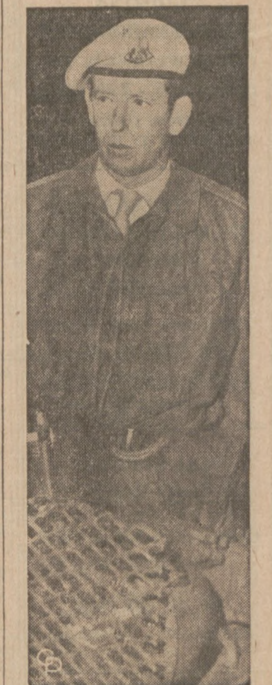
Z KRÓLEWSKA , zimna krewia bierze udział w patrolu wojskowym w Belfast, Ph. Irlandia, książę Kentu, Edward, kuzyn królowej Elżbiety II.

Atak na przestępczość ma być skierowany na rozległe operacje gangsterskie syndykatu kryminalnego w Chicago i na terenie północno-zachodniej części stanu Indiana.