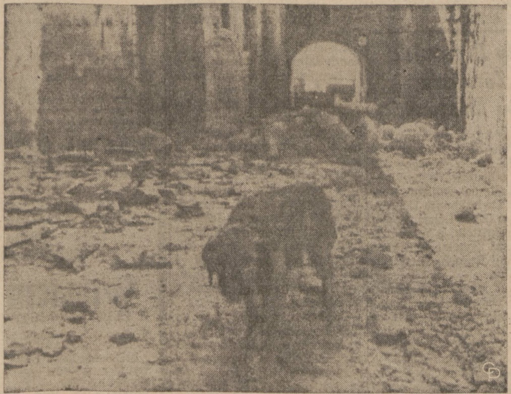
WŁOCHY — Niedawno miasto włoskie Tuscania zostało nawiedzone silnym trzęsieniem ziemi. Większa część miasta leży w gruzach podobnie jak widoczna na zdjęciu ulica.

DZIENNIK ZWIĄZKOWY 1201 Milwaukee Ave. CHICAGO, ILLINOIS 60622 C.O.D. nie wysyłamy