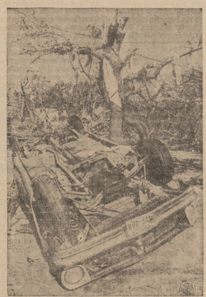
FLORYDA — Silne tornado jakie nawiedziło ostatnio okolice Pensacola rozbiło auto turysty z Teksasu. Tornado przeszło nad okolicą w godzinach rannych. Ogółem obrażenia odniosło 100 osób.