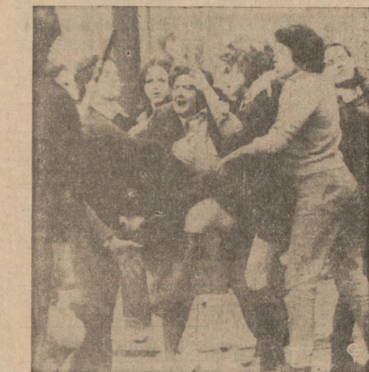
PLN. IRLANDIA — W Belfast, największym mieście Północnej Irlandii, w dalszym ciągu dochodzi do gwałtownych starć mniejszości katolickiej z protestantami. Na zdjęciu: dwie kobiety, jedna uzbrojona w pałkę, starają się zaatakować brytyjskiego żołnierza. Brytyjskie oddziały mają za zadanie nie dopuszczać do ostrzejszych konfrontacji między przeciwnymi stronami.

Ostatnie przedstawienie odbędzie się w Old Town Boys Club. Imprezy popierane i finansowane przez Illinois Arts Council oraz przez Endowment for the Arts.