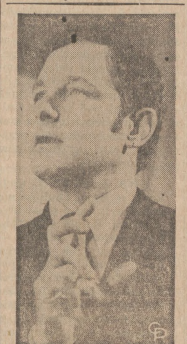
BADA SYTUACJĘ — Senator Birch Bayh (D-Ind.), oświadczył w Waszyngtonie, iż musi zbadać "kierunek wiatrów politycznych" zanim zdecyduje czy ogłosić swą kandydaturę na stanowisko prezydenta St. Zjednoczonych w przyszłych wyborach.

Tutaj prez. Nixon dodał, że otrzymuje codziennie raporty od gen. Creighton W. Abrams z Sajgonu, który stwierdza, iż operacje wojenne wojsk Płd. Wietnamu w Laosie są prowadzone na "najwyższym poziomie" ("in a superior way"). Mogę teraz powiedzieć, że sukces kampanii wojennej w Kambodży w ubiegłym roku i także sukces obecnej operacji wojennej w Laosie umożliwiają wykonanie programu wycofania wojsk US z Wietnamu — powiedział prez. Nixon. Wczoraj wieczorem odbyło się w Białym Domu przyjęcie dla 300 generałów i admirałów. Podczas ich przedstawienia, zaczynając od najstarszego ranga generała armii Omara N. Bradley, Prezydent wyraził się, że "ci, którzy przewodzą, muszą inspirować młodych do walki".