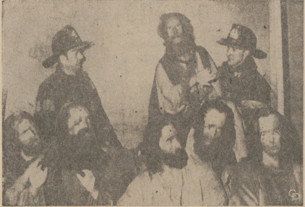
"CO TU SIĘ DZIEJE?" wydaje się pytać jeden z apostołów Chrystusa podczas przemierzania woskowych figur modelowanych na obrazie "Ostatnia Wieczerza". Figury wyniesiono ze zniszczonej pożarem galerii nowojorskiej "Believe It Or Not".