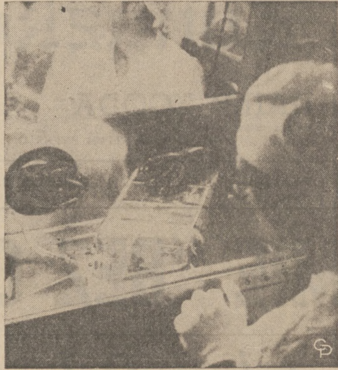
HOUSTON, TEXAS — W laboratorium badań Księżyca specjaliści poddają szczegółowym badaniom próbki kamieni przywiezionych z Srebrnego Globu przez załogę Apollo 14. Przypuszcza się, że mogą należeć do najstarszych formacji księżycowych.

Dalsze obrady dotyczyły różnych wyjaśnień, z których wynika, że nieruchomości i ruchomości Koła oszacowane są na dzień 1 stycznia 1971 roku na kwotę