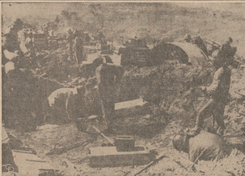
NA ZDJĘCIU: wypadowa baza oddziałów południowo-wietnamskich w głębi Loasu (8 mil od granicy Płd. Wietnamu). Dostawy sprzętu i amunicji dostarczane są z bazy w Khe Sanh, Płd. Wietnam, przez lotnictwo amerykańskie.

wydany w Państwowym Instytucie Wydawniczym. Dzieło o swoistej poetyce, odpatezowanej, uwydatniającej plastykę przedmiotu powstało przy użyciu określonej metody literackiej — świadomie zamierzony prymitywizm. W dziale prozy beletrystycznej zwróciła uwagę książka Andrzeja Kuśniewicza pt. "Król obojga Sycylii". Twórczość tego pisarza wyróżnia się dojrzałą, znakomitą techniką literacką. Jego nowa powieść opisuje okres poprzedzający I wojnę światową. Ale nie o barwność wydarzeń, o romantykę historii i losów ludzkich chodzi w tej książce. Kuśniewicz tworzy prozę psychologiczną, dramat wewnętrznego bohatera filmu, ukazany na tle światowej katastrofy, zyskując w powieści Kuśniewicza wyraz przejmujący.