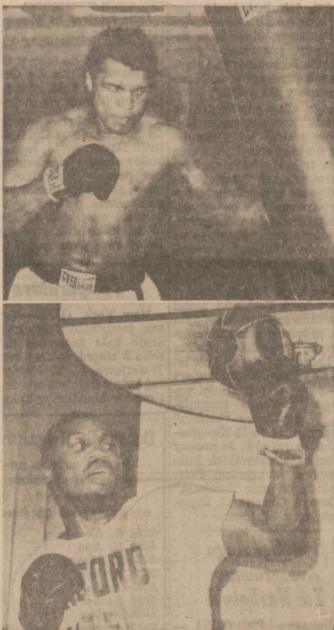
W HISTORYCZNEJ walce o mistrzowski tytuł w boksie zwyciężył jednogłównie w 15-iej rundzie Joe Frazier. Jego przeciwnikiem był Muhammad Ali (dawniej Cassius Clay). 70,000 kibiców sportowych w Chicago oglądało walkę w 16 miejscach, gdzie za opłatą (i to nie było jaka!) można było obejrzeć transmisję bezpośrednio z Nowego Yorku. U góry: Muhammad Ali, u dołu — Joe Frazier.