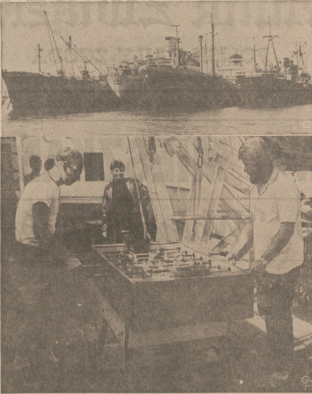
MARYNARZE uwięzionych na Kanale Sueskim statków od 6-dniowej wojny w 1967 roku nie mogą narzekać na brak rozrywek. Można nawet mieć wątpliwości czy kiedykolwiek myśla o momencie kiedy Kanał zostanie z powrotem żeglowny. U góry: — niektóre z 15 statków handlowych, które "utknęły" w kanale.