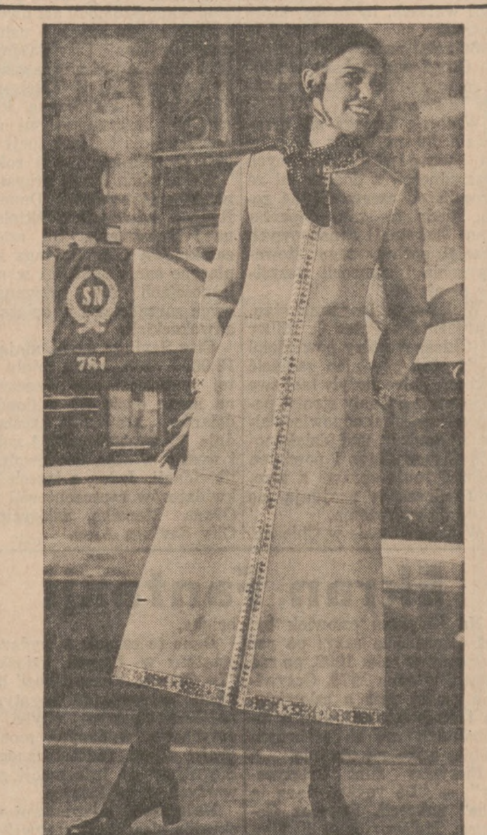
Suknia - płaszcz z gabardyny w jaskrawo żółtym kolorze. Model Victoria Joris.