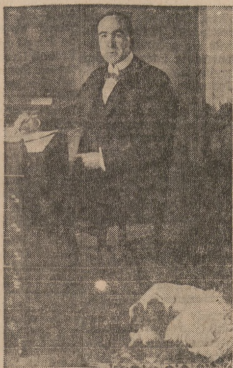
American Winston Churchill with a favorite companion, apparently of Spitz heritage.

The latter, of course, continued climbing politically, in spite of some reverses, but the Yankee Churchill gave up further aspiration to office-holding when rejected by voters as Progressive (T. Roosevelt "Bull Moose" party ticket) candidate for governor of New Hampshire. He continued authorship of some well-read novels, but was overshadowed completely in public consciousness by the British