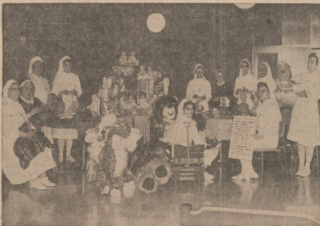
Na zdjęciu Siostry Nazaretanki i zespół pielęgniarek ze Szpitala Nazaretanek przygotowują fanty na Bazar.

Poprzyjcie Dobre Dzieło Pomocy Na Rzecz Szpitala