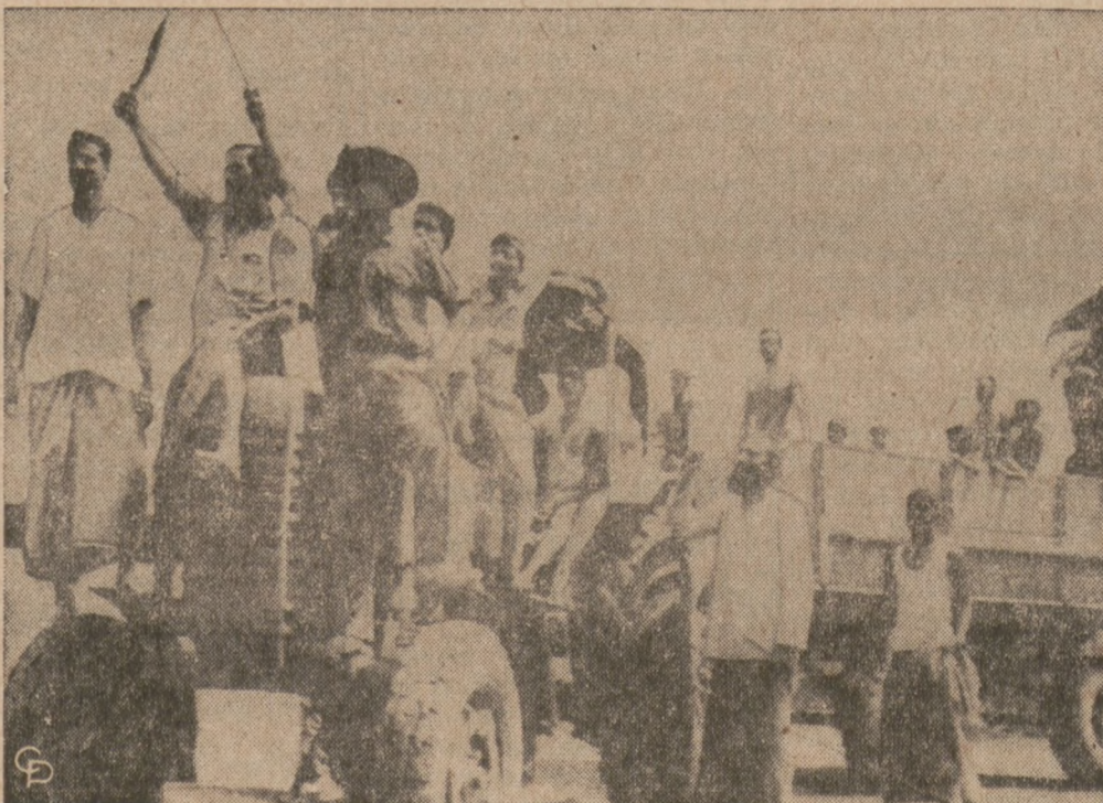
PAKISTAN WSCHODNI — Na zdjęciu: komandosi separatystycznego ruchu we wschodniej części Pakistanu śpiewają wojenną pieśń „Bangla Desh” przed rozpoczęciem zbrojnej akcji przeciwko rządowym wojskom z Pakistanu Zachodniego.