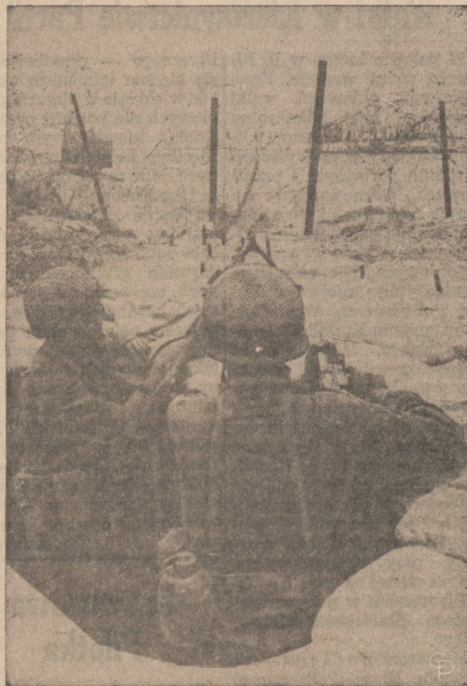
NA ZDJĘCIU: izraelscy żołnierze na punkcie obserwacyjnym bacznie śledzą wydarzenia po drugiej stronie Kanału Sueskiego gdzie znajdują się oddziały egipskie. Nieoficjalny rozejm na Bliskim Wschodzie trwa. Tylko jak długo będzie trwał bez konkretnego porozumienia?

Both Beliveau's Cup-winners were scored in 4-0 victories. His first was in 1960 at 8:16 of the first period against the Toronto Maple Leafs. Canadiens won the series in four straight games for a record fifth straight Stanley Cup championship. His other Cup-winning goal was in 1965 when he scored at the 14-second mark of the first period in the seventh and deciding game of the Final against the Chicago Black Hawks.