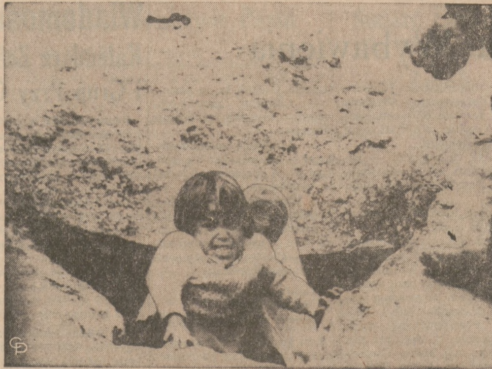
JORDANIA — Ludność cywilna wyjdzie się z podziemnego ukrycia w miejscowości niedaleko Jarash po przejściu przez okolicę oddziałów palestyńskich partyzantów.

Urzednicy z Social Security będą również udzielali wyjaśnień w tym banku w sobotę, dnia 17 kwietnia, od 9 rano do 12 w południe. Do dyspozycji osób zgłaszających się po informacje będą bezpłatne broszury dotyczące ostatnich zmian i uprawnień z Social Security i Medicare.