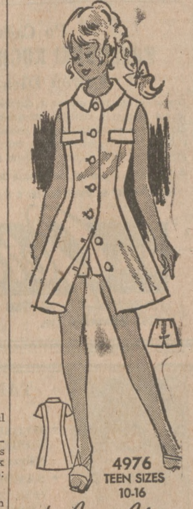
4976 TEEN SIZES 10-16