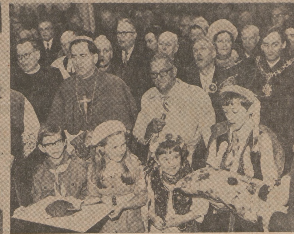
Górne z lewej: Na mszy św. w kościele św. Andrzeja Boboli z okazji poświęcenia kamienia węgielnego pod nowy gmach Polskiego Ośrodka Społeczno-Kulturalnego w Londynie.