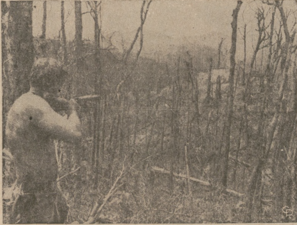
WJĘTNAM PLD. — Na zdjęciu, amerykański żołnierz strzela z granatnika w kierunku domniemanej pozycji komunistów w pobliżu A Shau Valley.

Władze domów mieszkalnych z Rady Powiatowej uchwałyły rezolucję dla zbudowania możliwości wybudowania domu, dla osób w po-destymowanym wieku w Franklin Parku, kosztem 2,1 milionów dolarów. Rada ogłosiła również, iż prowadzi rozmowy o budowę 100 jednostek dla rodzin o niskich dochodach w Evanston i mieszkań dla osób w podestymowanym wieku w Des Plaines, Harvey i w Arlington Heights.