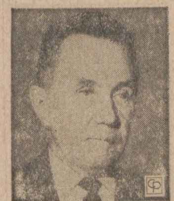
Sowiecki Premier — A. Kosygin

Oficjalna wizyta zaczęła się złożeniem kwiatów na grobie