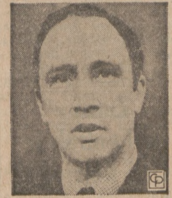
Premier Kanady — E. Trudeau

Moskwa. (UPI) — Kanadyjski premier, Elliott Trudeau, razem ze swym młodszą małżonką, którą pojął za żonę zaledwie kilka miesięcy temu, przybył do Moskwy z oficjalną wizytą. Kanadyjskiego premiera osobiście powitał muje