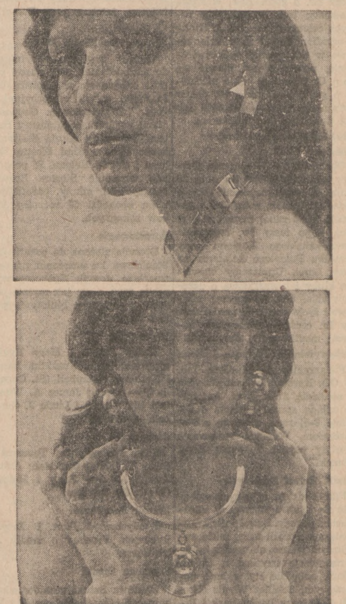
Modna biżuteria letnia, projektu Lanvin'a; złote lub srebrne kolczyki i naszyjnik.