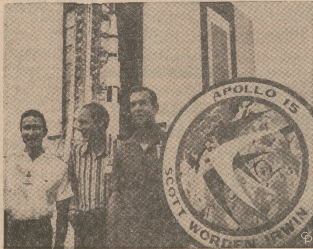
NA ZDJĘCIU: kolejna załoga amerykańskich astronautów, którzy 26-go lipca b.r. rozpoczną lot ku Księżycowi. Od lewej: James Irwin, Alfred Worden oraz David Scott.