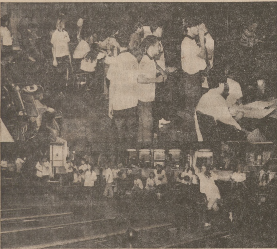
Shown above are some of the girls and boys representing the 26 junior teams from South Bend, Ind., LaPorte, Ind., and Hamtramck, Mich., rolling their games on the PNA 83 Lanes in South Bend, Ind., during the Annual National PNA Bowling Tournament last month.