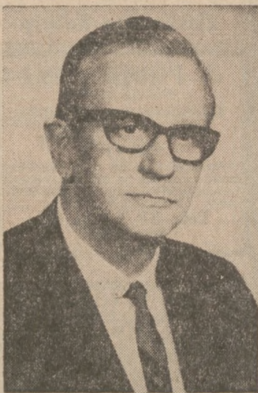
ROMAN KOSIŃSKI Repr. Stanowy

Reprezentant stanowy Roman J. Kosiński wniósł ostatnio do Izby Reprezentantów w Springfield kilka projektów ustaw, idących w kierunku reformy podatku od sprzedaży w tym kierunku głównie, żeby każdy, kto potrąca więcej, jak 5 procent z rachunku sprzedaży mógł ogłaszać się jako hurtownik. Ustawa o ochronie konsumenta nakłada szybyne kary na przestępców w wysokości $3,000 za pierwsze przestępstwo i $5,000 za przestępstwo każde następne, przy wykonaniu kolektowaniu podatku od sprzedaży detalicznej.