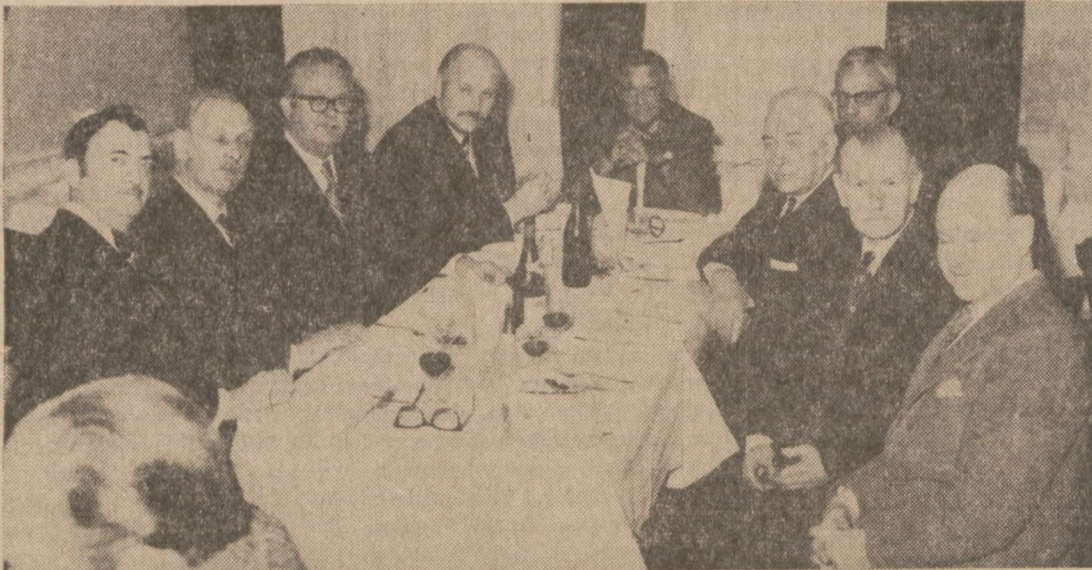
Na obiedzie w Stowarzyszeniu Lotników Polskich w Londynie