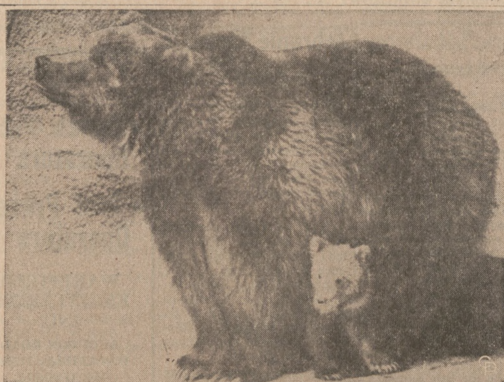
PRZY MAMIE BEZPIECZNIEJ — takiego "zdania" jest przynajmniej mały niedźwiadek w ogrodzie zoologicznym w Cleveland, Ohio. Zwierzęta zostały niedawno zakupione u handlarza zwierząt.

Wśród proponowanych ważnych zagadnień byłyby badania jak ludność się uczy, ujawnienie i stworzenie materiałów potrzebnych do nauczania, zbadanie sposobów finansowania edukacji i kosztów administracji oraz utworzenie szkół eksperymentalnych, w celu zbadania i wypróbowania inowacji w systemie edukacyjnym.