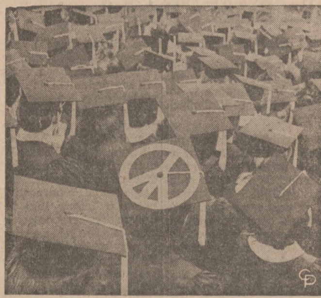
W CZASIE uroczystości rozdania dyplomów na uczelni Indiana University w Bloomington jedna z uczestniczek przyzdobiła swój beret popularnym znakiem pokoju...

• Assembly of the units has been simplified. Some models can be hooked up in 15 minutes or less and many require no tools.