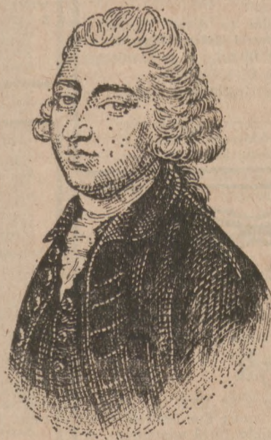
Early engraving of Edmund Burke from miniature by Joshua Reynolds, of Colonial affairs as Burke," it was observed.

He, who was to protest over and over the coercive measures against the British colonists in America, was born at Dublin of a Protestant father and a Roman Catholic mother. They sent him to a society of Friends (Quaker) school for instruction in the humanities before his tutelage in law at Trinity College and London's Middle Temple. When twenty-seven, he published Philosophical Inquiry into the Origin of Our Ideas on the Sublime and Beautiful. This was followed by Account of the European Settlements and Thoughts on the Causes of the Present Discontents. "Few Englishmen had so profound a knowledge