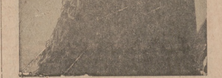
TROKATNY SZAL - sztucznej roboty, odpowiedni na chłodniejsze wieczory.

Tkanka liścia zostaje w punkcie silnego operowania promieni uszkodzona, wskutek czego zamiera, wykruca się i wypada. Aby zapobiec temu zjawisku, należy rośliny przesuwac co kilka dni, przesadzać liście, a w godzinach silnego nasłonecznienia lekko cieniować.