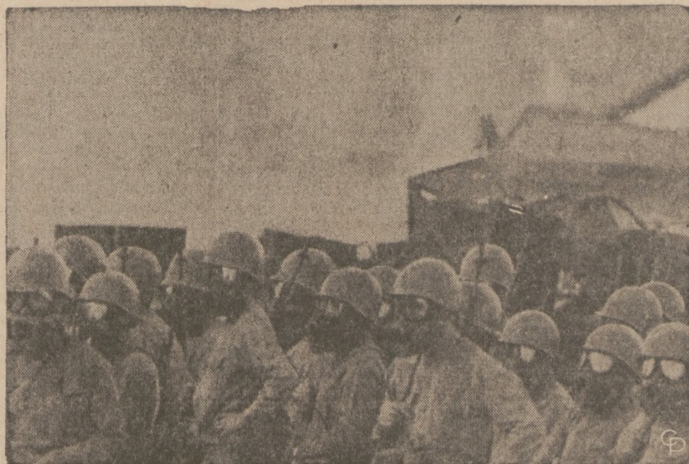
GWARZISCI W AKCJI — W Albuquerque, Nowy Meksyk, oddziały Gwardii Narodowej wezwane przez władze miejskie do zaprowadzenia porządku, zmuszone były do wdziania masek i użycia gazu łzawiącego. Wywroto elementy przewracali samochody, wybijały szyby okien wystawowych, rzucając w wojskowych butelkami z benzyną i kamieniami. W czasie zaburzeń aresztowano ponad 400 osób.