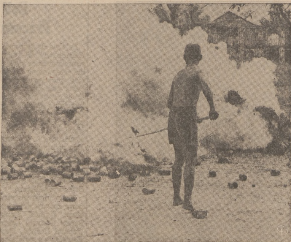
W WALCE Z NARKOMANIĄ i przemytem narkotyków władze miejskie w Sajgonie, Wietnam Południowy, wydały ostre zarządzenia likwidowania marihuany, opium i innych narkotyków oraz surowego karania handlarzy zakazanego towaru. Na zdjęciu: stos przechwyconych narkotyków spalany na ulicy miasta.

Drugi projekt dotyczy przekazania Kościołowi własności dóbr kościelnych na ziemiach poniemieckich, czego od dawna domagał się episkopat.