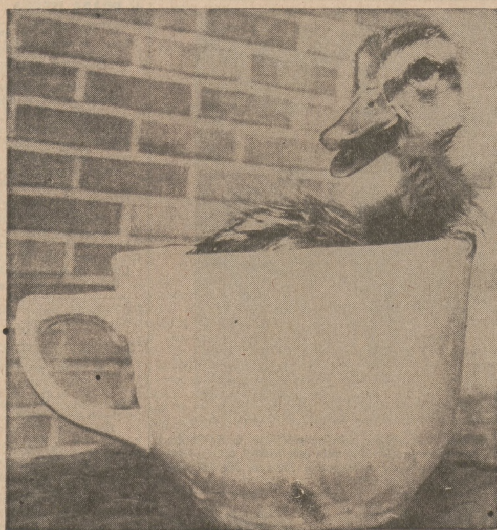
TO DWUDNIOWE KACZĄTKO nie jest zagorzałym amatorem kawy lecz umieszczono je w filizancie na atrakcyjny debiut przed kamerami. Nawet odpowiedni uśmiech uchwyciono! Mama na pewno będzie dumna.