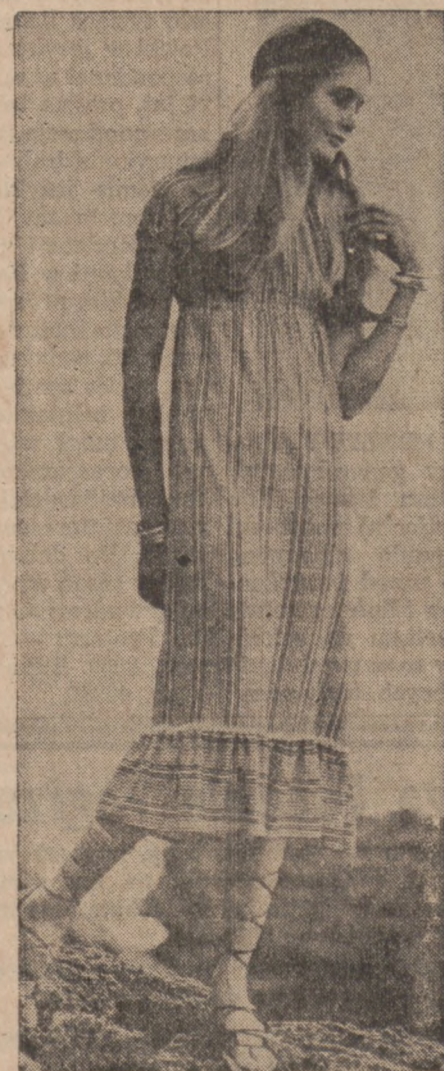
LETNIA SUKIENKA z bawełny w kolorach biało-niebieskim lub biało-czerwonym, zakończona szeroką falbanką.