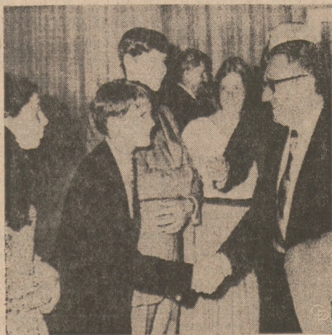
ODWIEDZIŁ RODAKÓW — Henry Kissinger (po prawej), doradca prezydenta do spraw polityki zagranicznej, w czasie niedawnej wizyty rządowej w Paryżu spotkał się z rodzinami amerykańskimi zamieszkałymi w stolicy Francji.