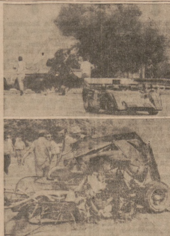
LAST RACE—Pedro Rodriguez, 31, Mexican racing driver, gives a thumbs up sign (right) before the start of his last auto race, at Nuernberg, West Germany. He was leading when his Ferrari smashed into a wall and burst into flames (top left) during the 200-mile race. The wreckage is at lower left.