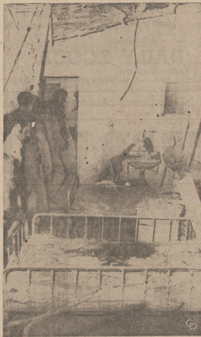
NA ZDJEĆCIU: ruiny izraelskiego szpitala 6 mil od Tel Aviv, zburzonego przez arabską rakietę. W wyniku eksplozji zginęły dwie osoby i 24 odniosły rany.