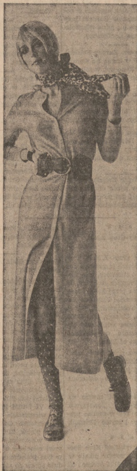
Suknia z jersey w kolorze popielatym lub beżowym.