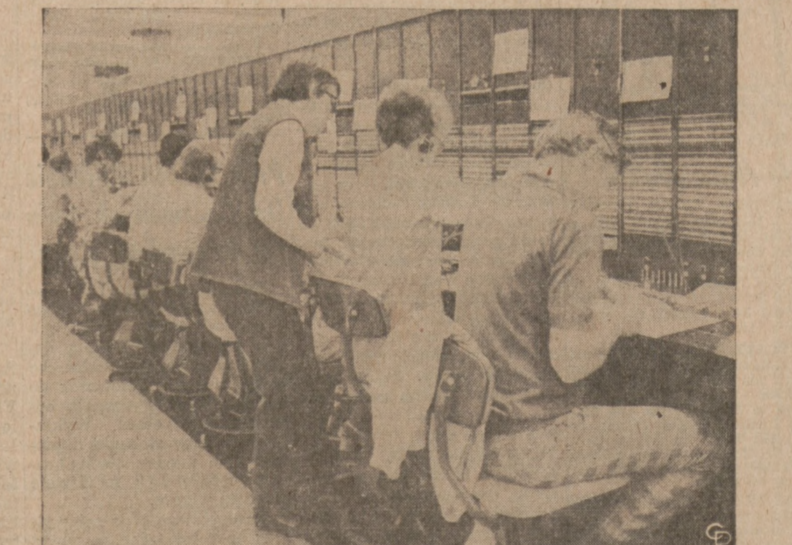
ZASTĘPUJĄ PRACOWNIKÓW: — Na zdjęciu, dyrektorzy i kierownicy działów kompanii Pacific Telephone and Telegraph w San Francisco, Cal. obejmują miejsca strajkujących pracowników.

Komisja Reformy pracuje nad tem, żeby w działalności Partii brało udział więcej członków, w szczególności Młodych Demokratów, kobiet i grup etnicznych. Ta inicjatywa chwyciła wszędzie i dlatego szeregi Partii we wszystkich stanach przeżywają obecnie "spokojną rewolucję" powiedział kongr. Fraser.