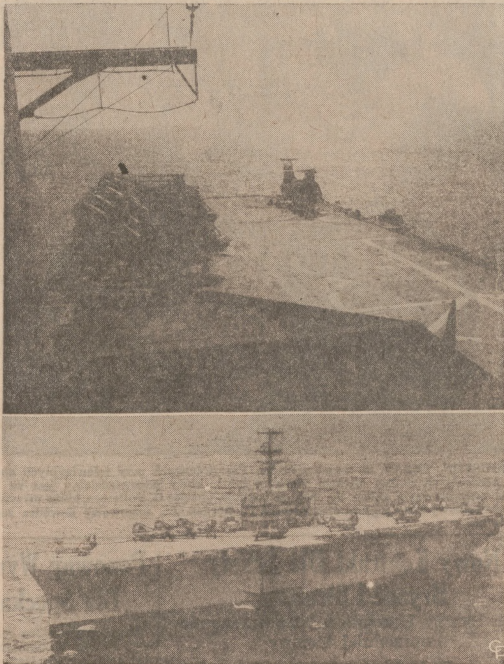
CZEKAJA NA BOHATERÓW — Widoczny na zdjęciu lotniskowiec helikopterów to "Okinawa", którego zadaniem będzie wyłowienie trzech astronautów po zakończeniu misji Apollo 15. Wodowanie kabiny załogowej ma odbyć się w odległości 300-tu mil na północny-zachód od wysp hawajskich.