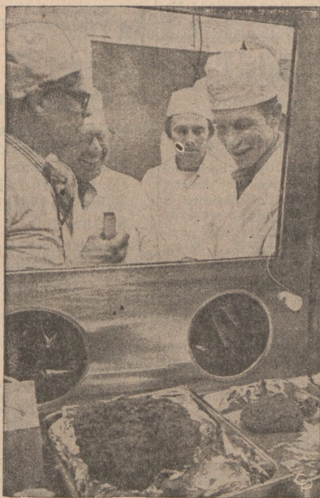
KSIEŻYCOWE SKAŁY — David Scott, kapitan załogi Apollo-15 ogląda przez szybę (po prawej) przywiezione z Księżyca próbki skał, w towarzystwie geologów Ośrodka Badań Przestrzennych w Houston, Tex.

Dalej idą łyżwiarze, piłkarze ręczni i saneczkarze — po niemal 6 procent. Ponad dwa procent urazów doznał hokeistów i szermierzów. Dopiero na dziesiątym miejscu, z ilością 1,5 procent, urazów, znalazł się boks. Taką samą ilością mogą poszczycić się lekkoatleci. A najkorzystniej w tej tabeli prezentuje się tenis.