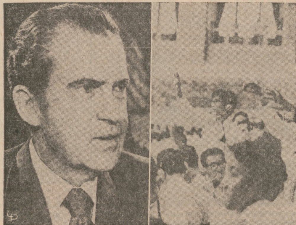
ZAMROZENIE CEN I PŁAC zapowiedziane w ostatnim wystąpieniu Prezydenta Nixona zaskoczyło przywódców rządowych w innych krajach. Poza granicami kraju dolar już od pewnego czasu napotykał na poważne trudności w kołach finansowych i na giełdach. W Japonii Bank Narodowy musiał interweniować, żeby kurs dolara na giełdach nie spadł poniżej oficjalnego. Po prawej—podeksytowani urzędnicy giełdowi w Tokio.