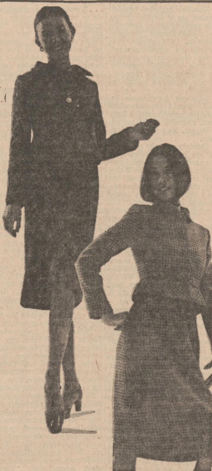
Dwa komplety modnych garsonów. Z lewej komplet z wzorzystego polysteru, żakiet zapinany na zamek błyskawiczny. Z prawej garsonka w drobna kratkę, w kolorach wiśniowym, różowym i ciemno beżowym.