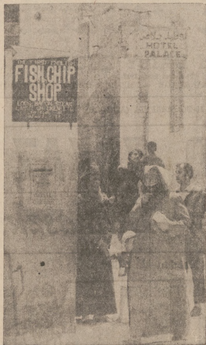
MAROKO — W marokańskim mieście Tanger można zauważyć postępujący proces cywilizacji europejskiej. Na zdjęciu: specjalnie dla turystów nowa restauracja z angielskimi potrawami.