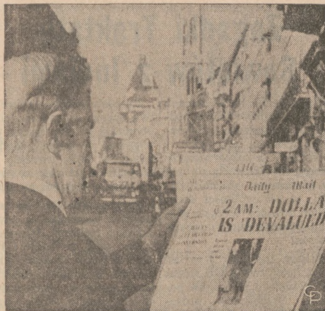
"DEWALUJKA" — Londyński przechodzień czyta w dzienniku lokalnym o postanowieniu amerykańskiego rządu o zamroźeniu cen i płac celem ożywienia gospodarki i ratowania dolara przed dewaluacją.